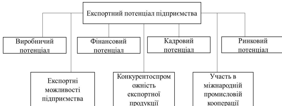
Рисунок 2. Структура експортного потенціалу підприємства

ринки. За цією структурою фахівці виділяють виробничий потенціал, фінансовий, кадровий, експортні можливості підприємства, ринковий потенціал, конкурентоспроможність експортної продукції та участь у міжнародній промисловій кооперації. За всіма напрямками виділяється цілий комплекс показників, але наявність такого багатокомпонентного аналізу за кожним напрямком не дає можливості підприємству швидко зреагувати на зміни та виявити слабкі й сильні місця виробництва. Запропонована структура експортного потенціалу вимагає для оцінювання багато часу й кваліфікації персоналу й призводить до некоректного оцінювання в процесі планування виходу підприємства на міжнародний ринок [6].