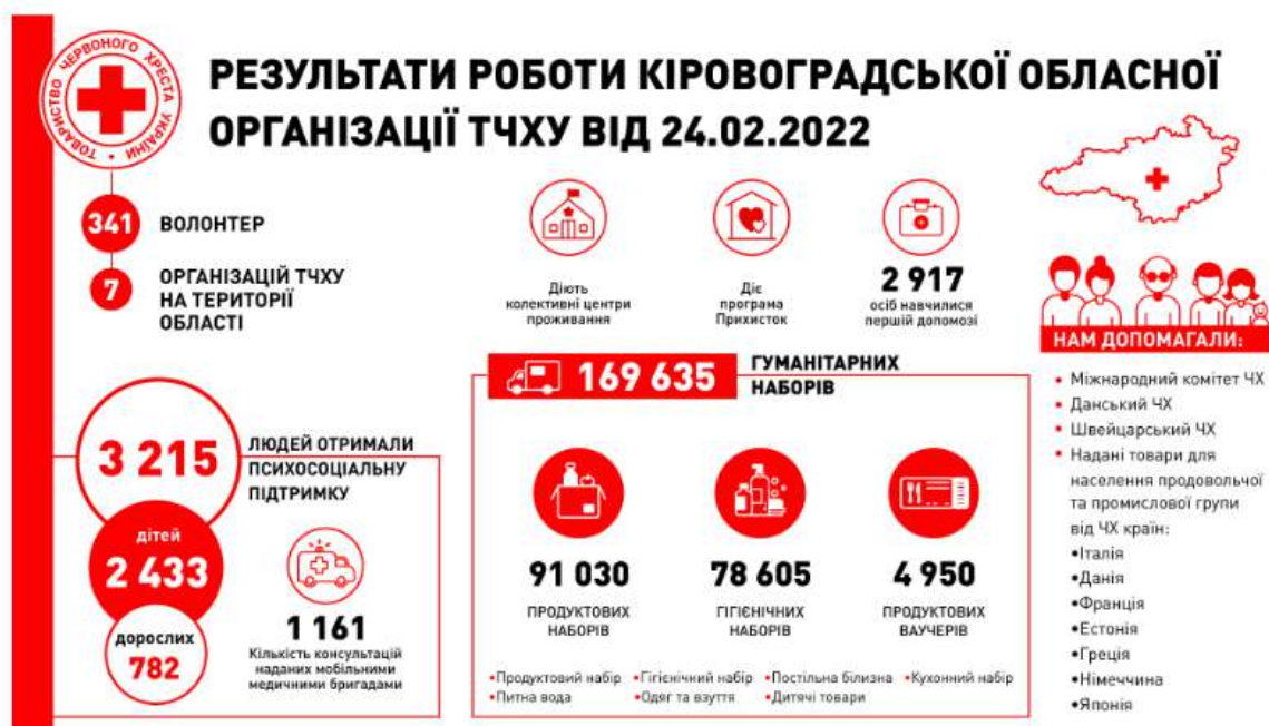
Рисунок 4. Результати роботи Кіровоградської обласної організації ТЧХУ від 24.02.2022 р. станом на 31.12.2022 р. [5]

Кіровоградська обласна організація Червоного Хреста України постійно задіяна у наданні допомоги: проводить навчання з першої допомоги, інформує про мінну небезпеку, першу психологічну допомогу та надає іншу важливу інформацію; приймає, сортує та видає внутрішньо переміщеним особам продукти харчування, медикаменти, одяг, засоби гігієни, підгузки, інші першочергово важливі предмети; допомагає з організацією перевезення людей по Україні; долучає до Червоного Хреста України нових волонтерів.