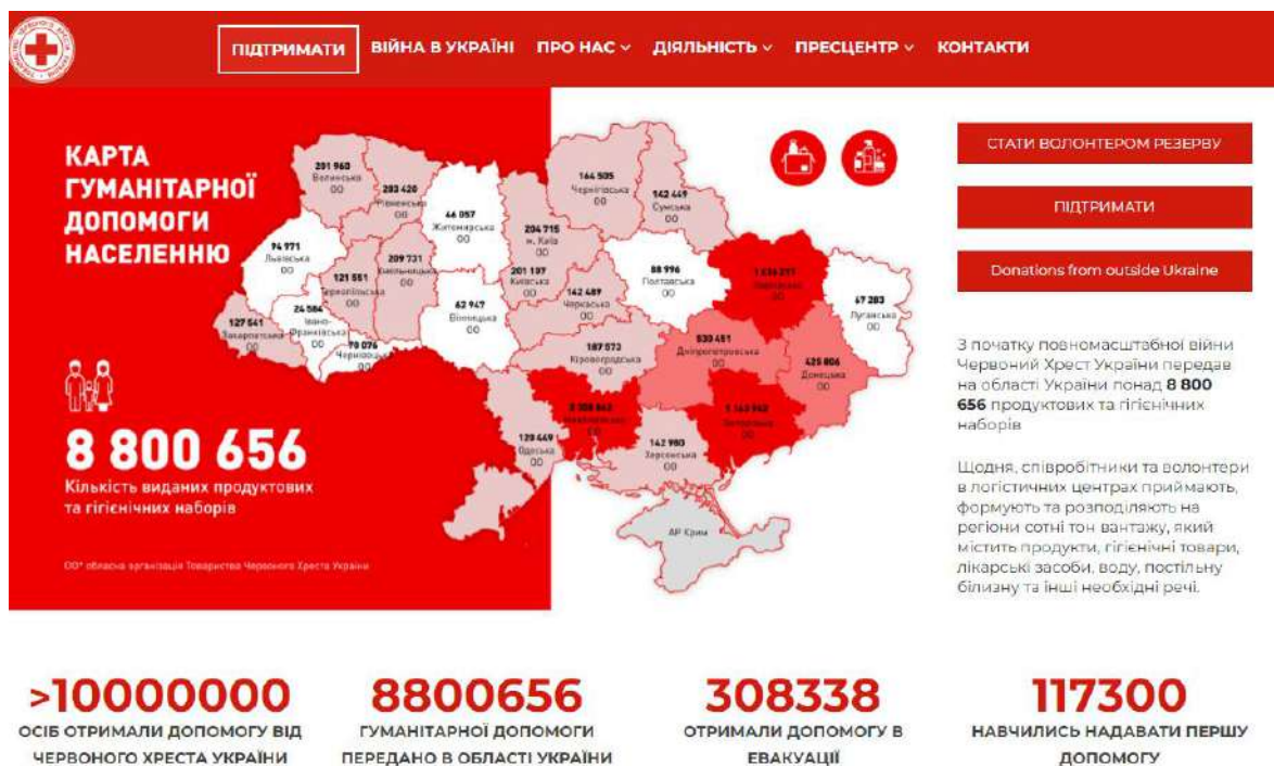
Рисунок 1. Карта гуманітарної допомоги населенню [5]