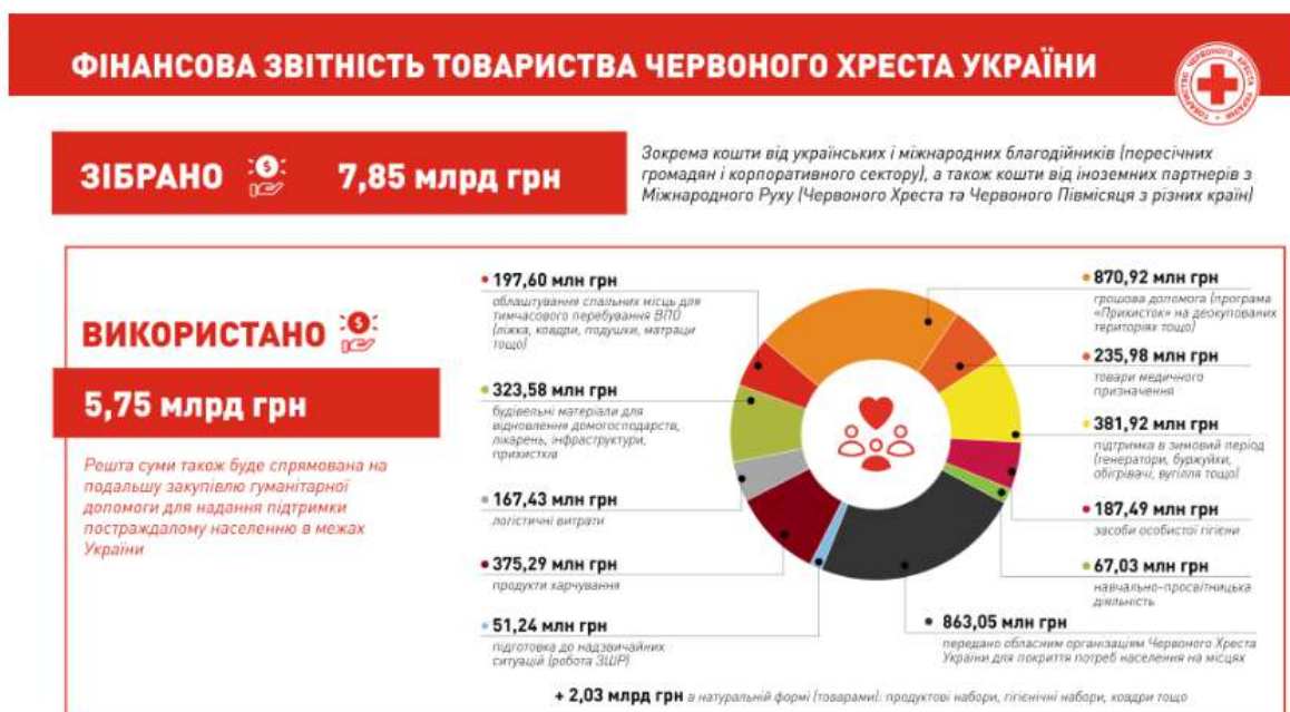
Рисунок 3. Фінансова звітність Товариства Червоного Хреста України [5]

Все викладене вище наочно показує, яку величезну роботу виконують благодійні організації та волонтерські рухи по роботі із соціально незабезпеченими верствами населення України.