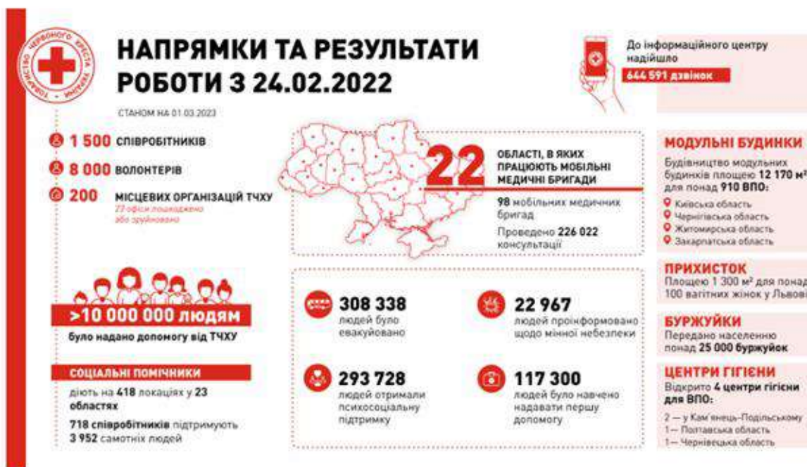
Рисунок 2. Напрямки та результати роботи з 24.02.2022 р. станом на 23.04.2023 р. [5]