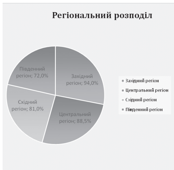
Мал. 1. Показники рівня патріотизму українського народу

З огляду на вищевказані результати з різних років, можна погодитися із думкою В. Кулика про те, що особливістю щодо України є несформованість та контраверсійність ідентичності. Вона була знівельована довгим часом