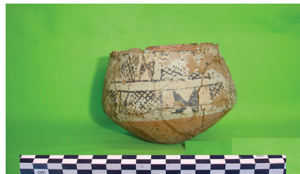
Рис. 1. Расписной сосуд из кургана Гасансу.