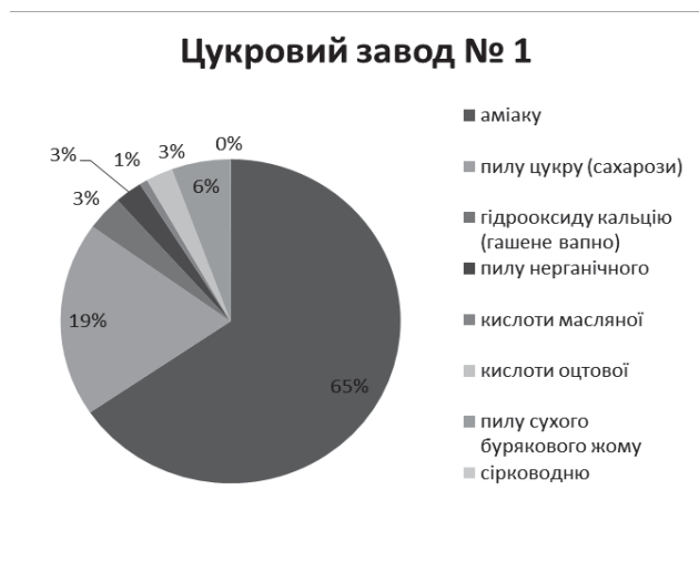
Діаграма 2. Валові викиди забруднюючих речовин в атмосферне повітря від основного виробництва цукрових заводів, у % загальної кількості валових викидів.

Валові викиди забруднюючих речовин в атмосферне повітря від основного виробництва цукрових заводів наведені на діаграмі 2.