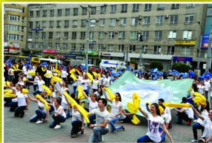
Флешмоб “Україно, ми єдині!”