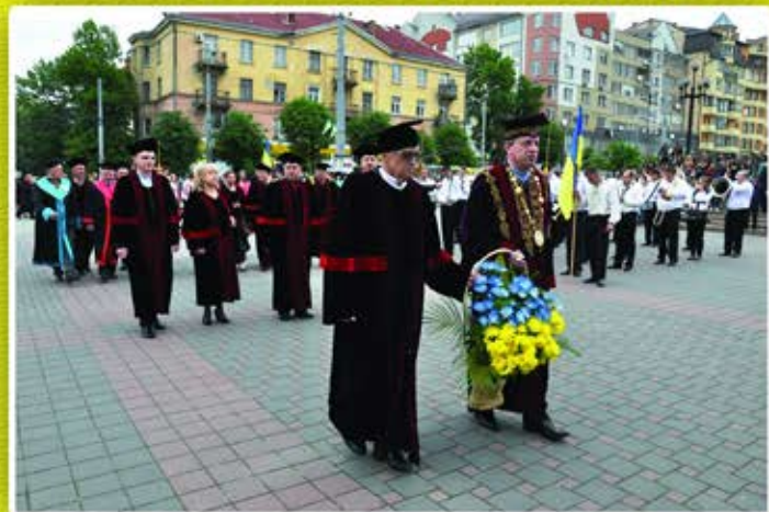
Покладання квітів до пам'ятника І.Я.Франка