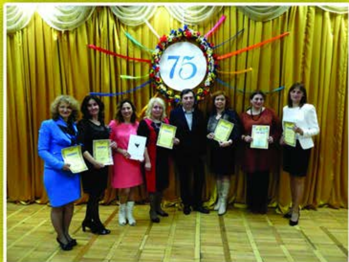
Нагороди від облдержадміністрації