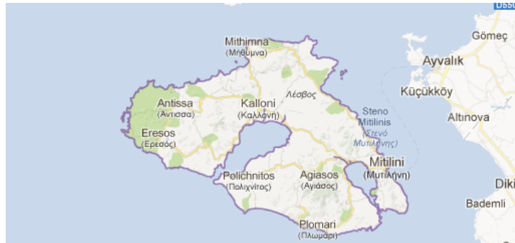
Рис.1. Острів Лесбос – один з найбільших середземноморських центрів острівного туризму

побережжя півострова Мала Азія (населення близько 100 тис. чол) (рис.1,2). Площа 1636 км 2 – третій за величиною грецький острів і сьомий за величиною в середземноморському басейні. Пагорби і гори висотою до 967 м (гора Олімбос), багато зручних бухт, термальні джерела, середземноморські чагарники, ліси, маслини (понад 900 тисяч дерев), вирощування цитрусових, тютюну. Розвинене рибальство, розробки мармуру.