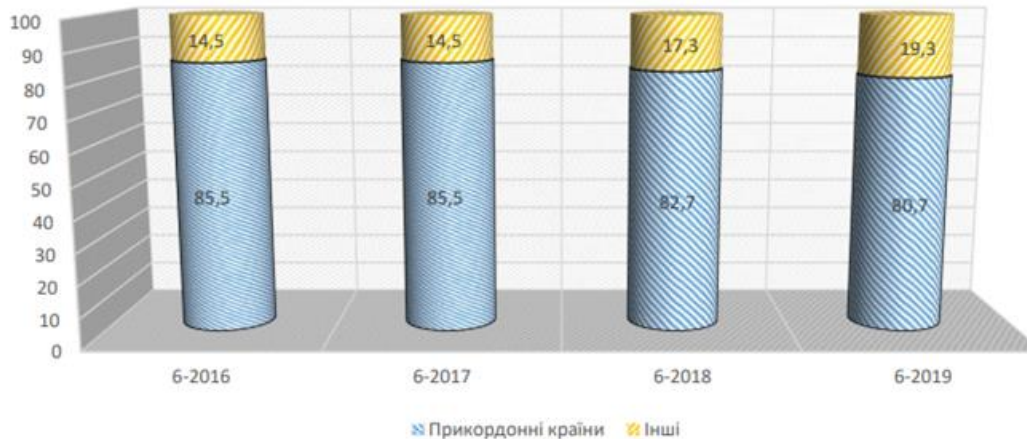
Рис. 2 Структура в'їзного туристичного потоку, % [4]

зменшення таких операцій у порівнянні з 2018 р. (послугами туроператорів скористалися 3 376,4 тис. туристів) [4]. Така тенденція мала позитивно вплинути на економічну складову України і загалом на імідж країни.