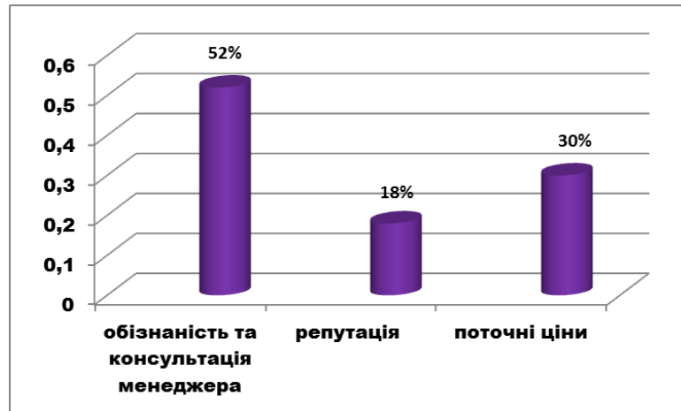
Рис. 2. Основні позиції вибору агентства для придбання туру до Єгипту

При виборі туристичного агентства спостерігається певна тенденція. Вона полягає в тому, що туристи, які обирають тури за рекомендацією знайомих або родичів, звертаються в те ж саме туристичне агентство. Для туристичного агентства важливо на цьому етапі не втратити туриста, який прийшов по рекомендації. Тому одне з питань анкети стосувалося виявлення відсотку втрачених туристів. Результати опитування показали, що таких туристів майже третина – 34%. Причини відмови від послуг рекомендованого агентства, як показали результати анкетування, полягали у недостатній обізнаності менеджера із туристичним продуктом, неповних та невпевнених відповідях на питання, які стосувалися порядку перетину кордону, переліку лабораторій, де можна здати тест ПЛР та інформації, яка має бути в тесті, недостатньо приділеному часі для туриста, небажанні менеджера працювати із туристом. Такий високий відсоток втрачених туристів свідчить про певні недоліки в роботі туристичного агентства. Тому, на питання «Чи б Ви хотіли в майбутньому знову скористатися послугами цього туристичного агентства?» 85% серед туристів, які вже відмовилися від послуг туристичного агентства, однозначно відповіли, що «ні». 2020 рік показав, що робота туристичного менеджера вимагає постійного вдосконалення та дуже швидкого професійного реагування на ті зміни, яке висуває життя.