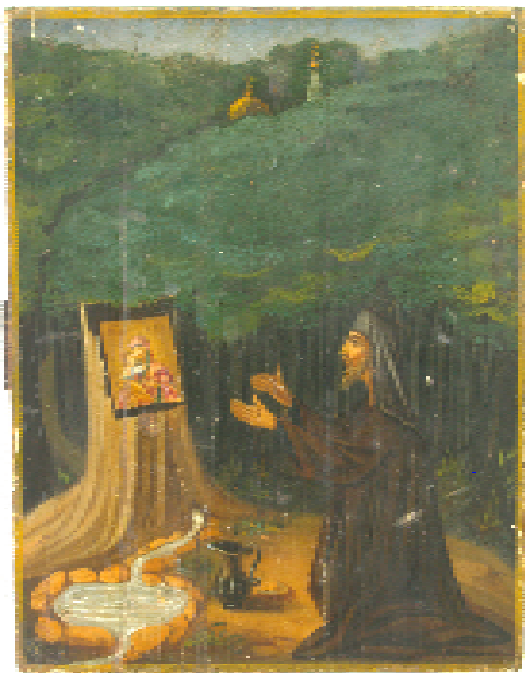
Ил. 1. Явление Владимирской иконы Пр. Богородицы в с. Кочеток. ЧХММ жв 53.