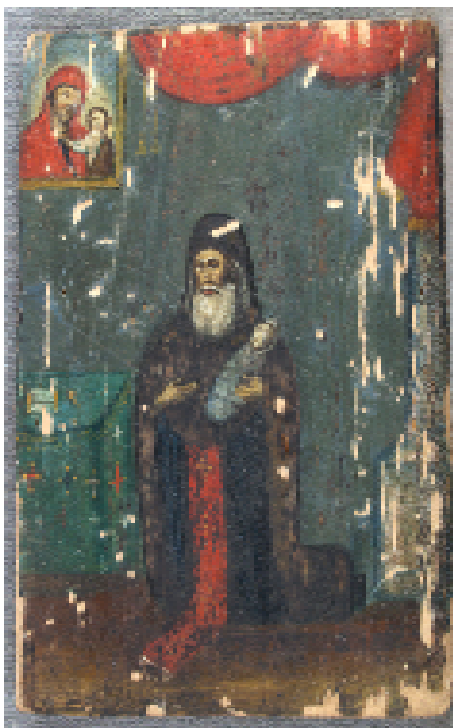
Ил. 4. Св. Исталаин вт пол 19 ст. (частн. собр.).