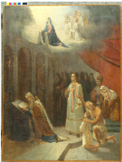
Ил. 5. Покров Пр. Богородицы. вт. пол 19 в.