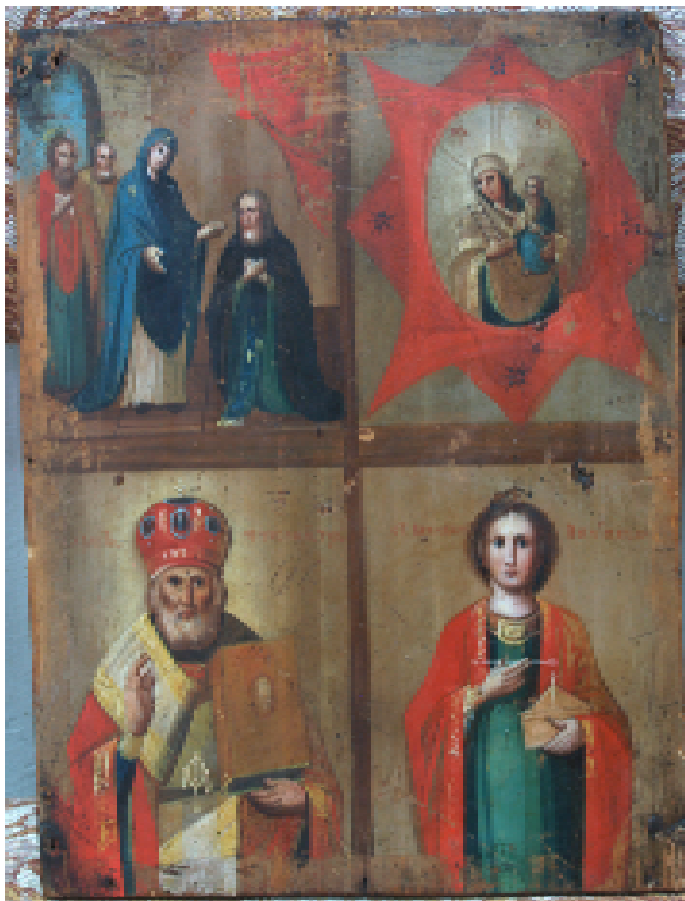
Ил. 9. Четырехчастная икона. Слобожанщина втор. пол. 19 в. XXM.

у старообрядцев. Слобожанские иконы Воскресения с Праздниками исключают изображения Сошествия во Ад, помещая только изображение Воскресения, которое следует западной схеме – Христос в лентионе и с лобарумом в руках выходит из саркофага. Примером этому может служить икона, выявленная в частном собрании г. Харькова. Несмотря на то, что одной из функций таких икон является доказательство главенства Воскресения Христова в противовес превознесения на западе Рождества, иконографически праздники, изображенные на иконе, восходят не к православным образцам, а к западноевропейской гравюре, в частности гравюрам немецкого графика сер. XIX ст. Ю. Шнорра [1], которого Ф. Буслаев именовал как «водителя русских живописцев» [2]. Однако по расположению клейм икона полностью следует Православной традиции.