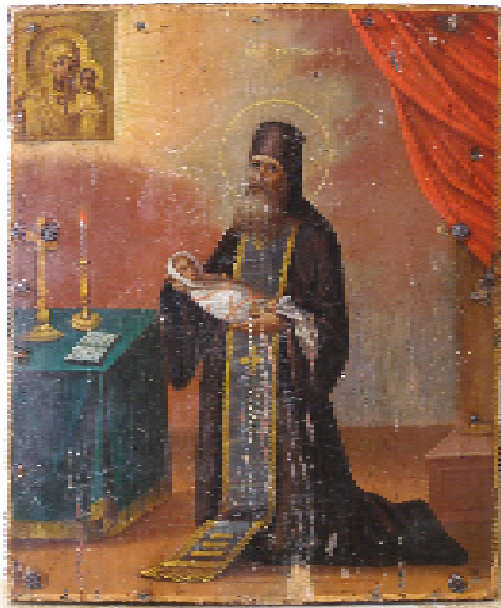
Ил. 3. Св. Исталаин. вт. пол 19 в. ЧХММ ж 53.