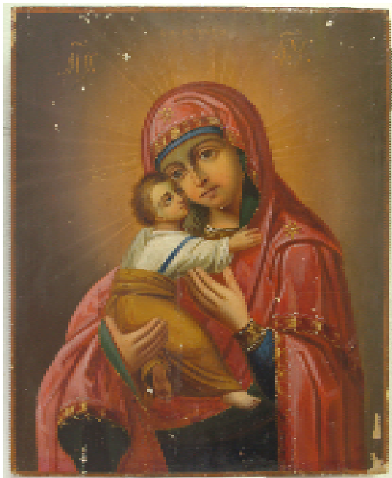
Ил. 2 Владимирская икона Пр. Богородицы. (Владимирская- Чугуевская икона) ЧХММ.