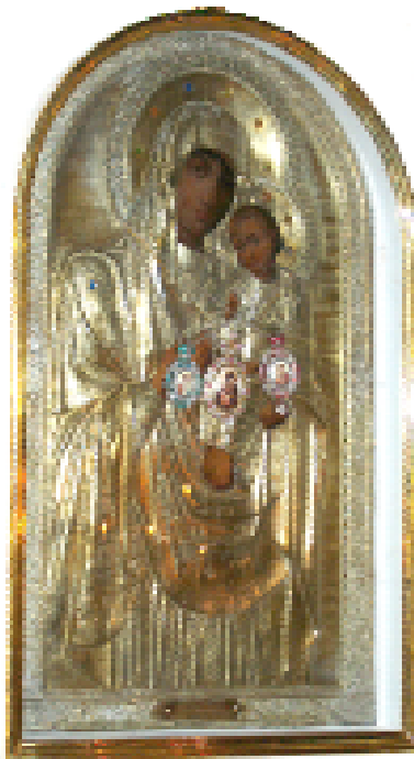
Ил. 8. Песчанская икона Пр. Богородицы. Вознесенская ц. г. Изюм.

художественного музея выявлена четырехчастная домашняя молебельная икона (ил. 9), изображения на которой отвечали про стьм, и в тоже время насущным человеческим нуждам. Изображение помещено в четырех клеймах. В первом клейме изображено «Сергиево видение», во втором – икона Богородицы «Купина Неопалимая», в третьем – св. Николай Чудотворец и в четвертом – св. Пантелеймон Целитель. Согласно преданиям и народным представлениям, эта икона изображает все самое необходимое, что нужно Православному христианину в его жизни. На первое место поставлен идеал святой монашеской жизни («Сергиево видение»). Здесь необходимо вспомнить об актуальности во второй половине XIX – нач. XX в. темы старчества. На втором месте помещена икона Неопалимой Купины (в Слобожанском варианте) – заступница от пожаров, на третьем св. Николай – ходатай перед Богом, заступник путешественников, и наконец – в последнем клейме Св. Пантелеймон, которому молились о быстром исцелении.