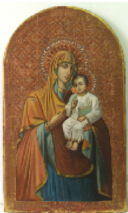
Ил. 7. Песчанская икона Пр. Богородицы ЧХММ ж 175.