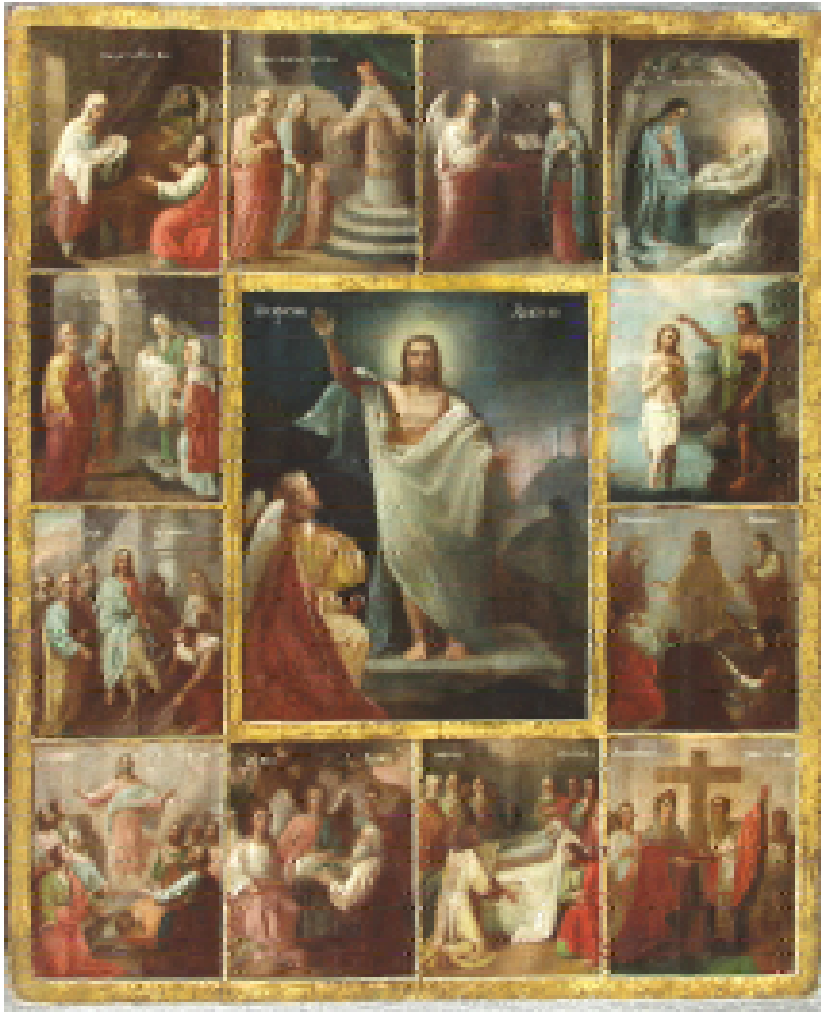
Ил. 10. Воскресение. нач. 20 ст. Слобожанщина.