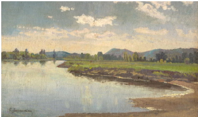
Ил. 5. «Пейзаж с рекой» х.на. картоне, масло. 18 x 29,5 см.

вывод, что фальсификаторы использовали для изготовления подделки работу середины XX в.