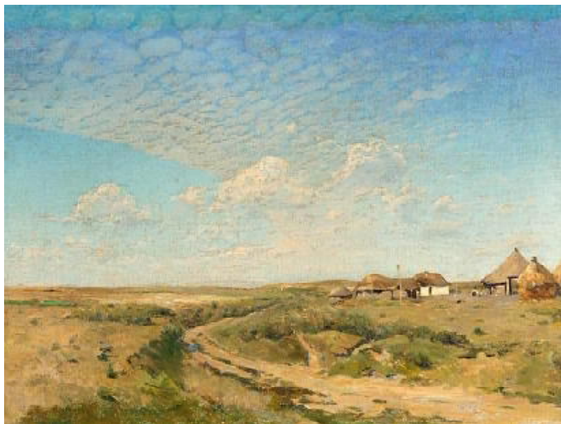
Ил. 2. «Деревушка в украинской степи» холст на дереве, масло. 33x44 см.