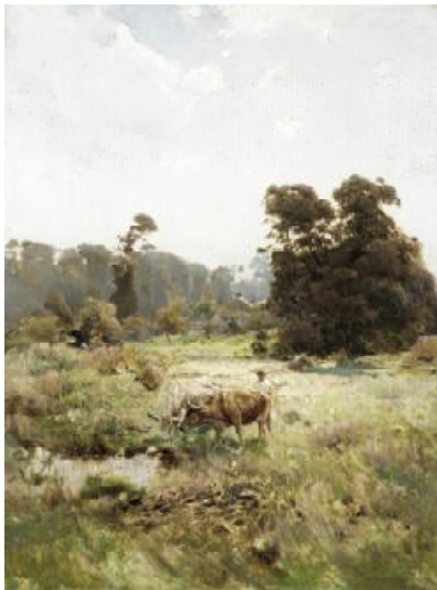
Ил. 1. «Казачья левада. Украина» дерево, масло. 34,5x26,5 см.