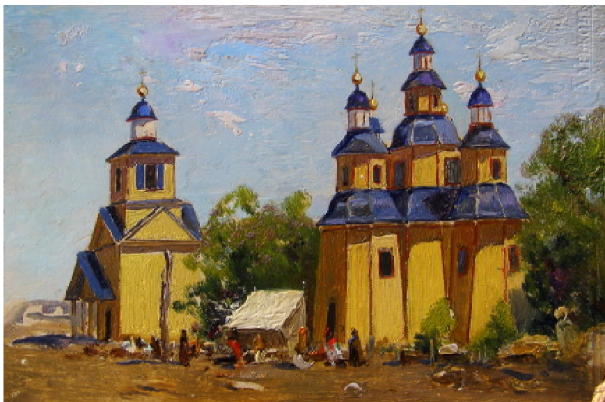
Ил. 6. «Церковь Рождества Пресвятой Богородицы», к.м. 11,3x16,8 см.