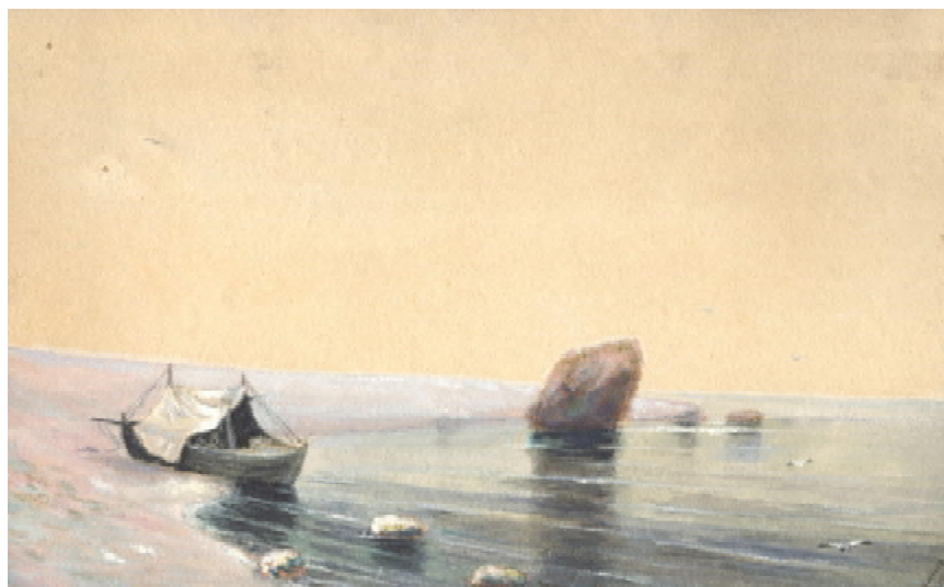
Ил. 4. «Пейзаж с лодкой» бумага на картоне, акварель, белла.