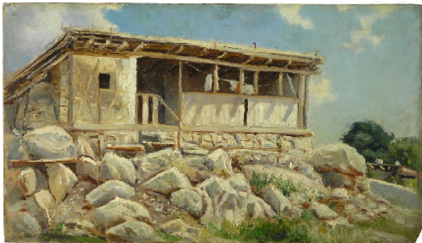
Ил. 3. «Крымский пейзаж» дер. масло. 19,1x33,8 см