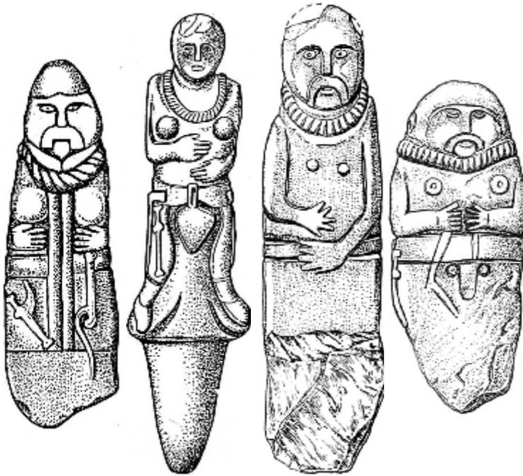
Рис. 3. Статуї із зображенням верхнього одягу VI ст. до н.е.

У першу чергу вияснимо, чи був присутній цей елемент раніше, чи сформувався вже під час перебування скіфських племен на території Північного Надчорномор'я. Спираючись на хронологічні дані, бачимо, що зображення нагрудних блях було притаманне лише у VI ст. до н. е. Тому аналог слід шукати у ранньо-скіфському мистецтві Північного Кавказу або уродинних зв'язках племен кіммерійського періоду. Розглядаючи основні елементи декору скульптури Кавказу VII ст. до н. е., можна побачити подібні прикраси на стелах із с. Замай-Юрт і с. Воровсколеське, а також на двоголовій статуї із с. Мескети [2, с. 171-172, іл. 83, 84]. Це свідчить, що зображення цих елементів скіфського одягу бере свій початок на території західного Надчорномор'я та узбережжі Каспійського моря у VII ст. до н. е. і вказує на міграцію скіфських племен на захід [1, с. 95].