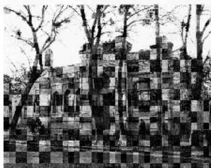
Вул. Паризької Комуні, 15