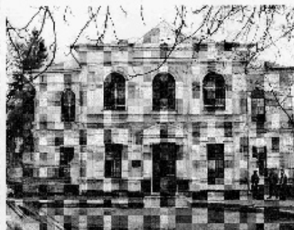
Вул. Р.Кириченко, 1