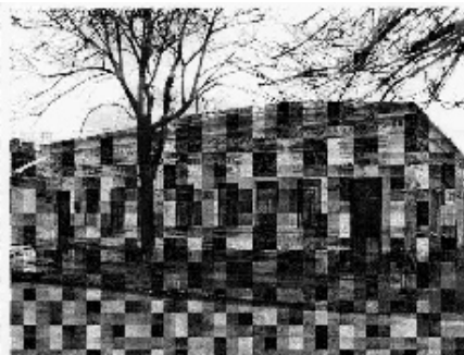
Вул. Шевченка, 13