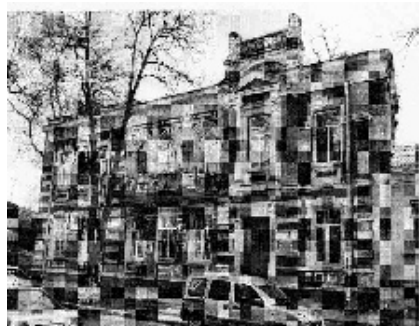
Вул. Комсомольська, 43