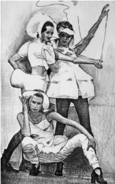
Іл. 4. Одна з перших творчих колекцій театру-студії „Райські птахи” – т. зв. „Біла”.