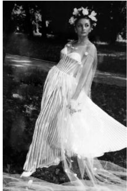
Іл. 5. Сукня для нареченої від Оксани Караванської – ніжність, креативність і сміливість в одному образі.