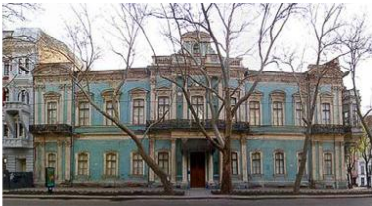
Рис.7. Дворец Абазы,1855-1857 гг., арх. Л.Ц. Оттон