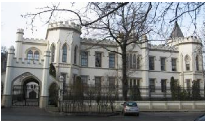
Рис.3 Дворец Бржозовского, 1852 г., арх. Ф.В. Гонсиоровский