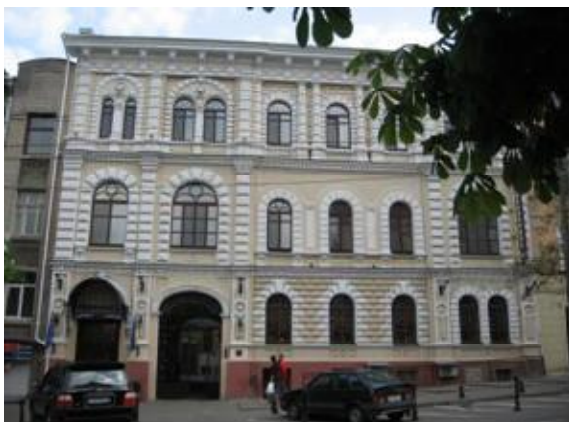
Рис.6. Дом Абрамсона., 1852г., арх. И.С.Козлов