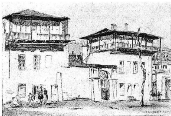
Рис. 1 Крымско-татарские приёмы в архитектуре Одессы

Период 1800-1840-х г. нельзя, в полной мере, отнести к одному из этапов развития архитектуры историзма в Одессе. Изначально архитектура города отличалась стилевым разнообразием. На первом этапе развития Одессы многие жилые дома носили черты, характерные для татарской (рис. 1), греческой, балканской архитектуры [6], что обусловлено, прежде всего, многонациональным составом населения, влиянием традиций национальной архитектуры. В 1820-1840-е гг. возводятся ансамбли полукруглой площади, Приморского (Николаевского) бульвара, Театральной площади; застройка