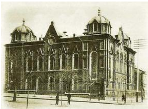
Рис.4. Бродская синагога, 1863-1870гг.