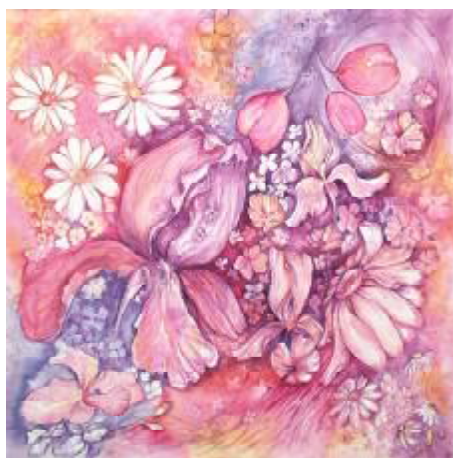
Рис. 1. Техніка холодного (а) та гарячого (б) батіку