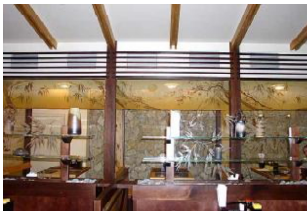
Рис. 3. Використання батику у ресторані «Тонукі»