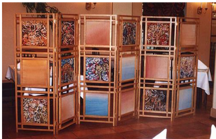
Рис. 4. Використання ширми з тканинним розписом