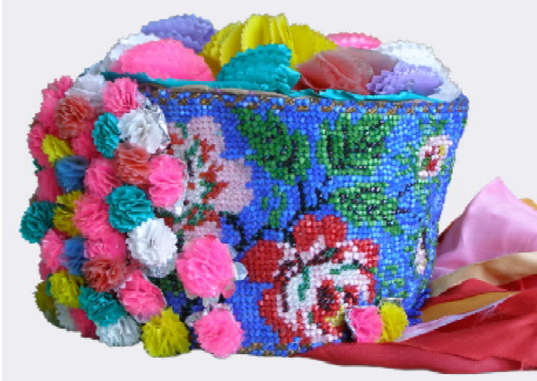
Лл. 2. Дівочий головний убір “кода”. 1970–80-ті рр., с. Погорілівка Заставнівського р-ну Чернівецької обл.