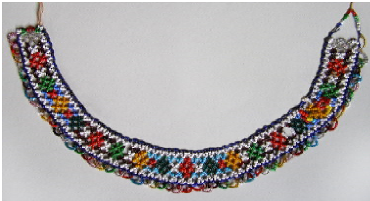
Лл. 3. Сіянка одnodільна. Бісер, нитки, нанизування на 8 ниток. 1960-ті рр., с. Самакова Путильського р-ну Чернівецької обл.