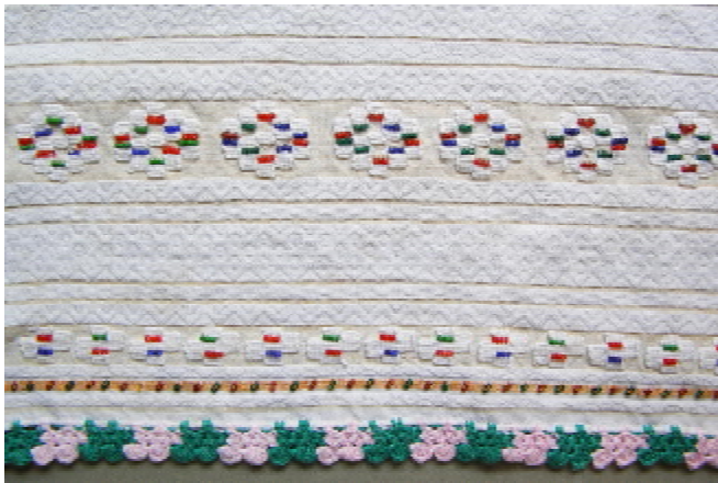
Іл. 5. Намітка “рушник”. Фрагмент. Лляні та бавовняні нитки, бісер, перебірне ткання, вишивання, в’язання гачком. Початок ХХ ст., с. Мосорівка Заставнівського р-ну Чернівецької обл.