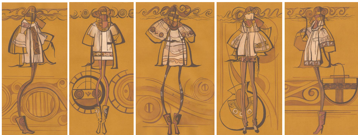
Рис. 2. Ескізи колекції одягу за мотивами Трипільської культури студентки VI курсу С. Гніденко