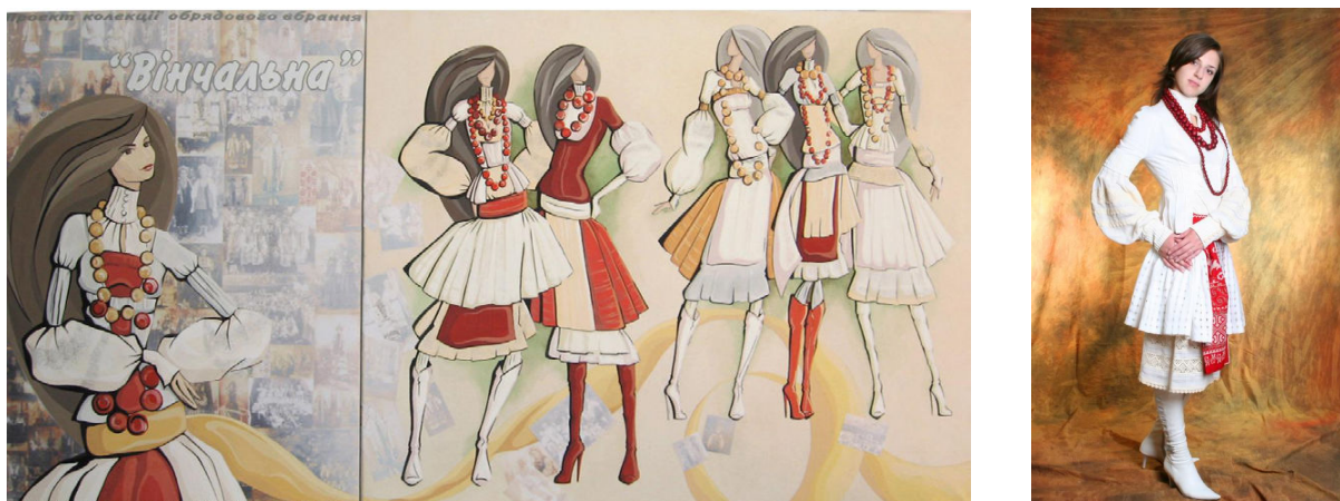
Рис. 3. Випускна робота бакалавра І. Макарової за мотивами дівочих костюмів Наддніпрянини