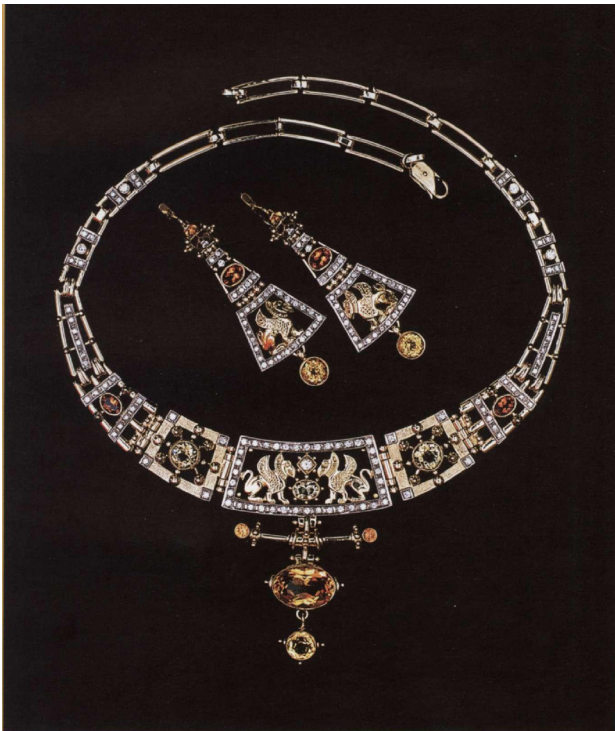
Мал. 2. Комплект «Легенда Скіфи» ВАТ «Українські ювеліри. Художник – О. Богачова, виконавці: Ю. Гутковський, В. Голуб

ходила велика кількість предметів розкоші – килими, прикраси, зброя, посуд, тканини, – декор яких, в свою чергу, сприяв розвитку орнаментики ювелірного мистецтва.