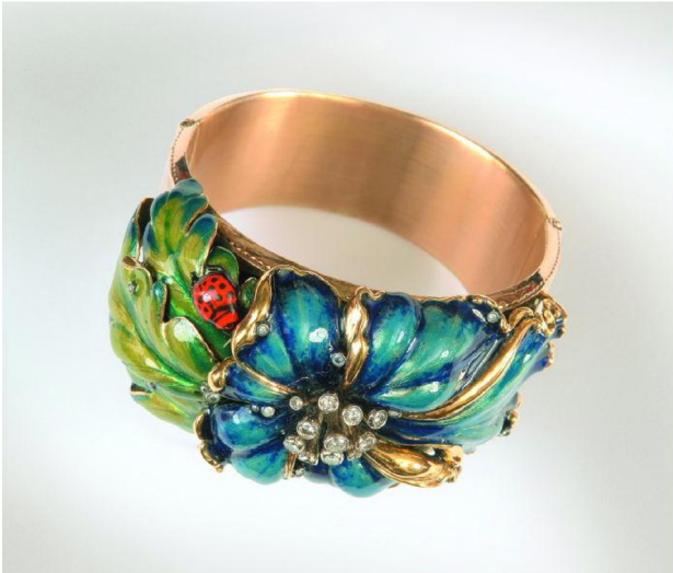
Мал. 1. Браслет «Літо» Художник-ювелір: Станіслав Вольський