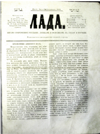
Іл. 1. Галицькі часописи для жіночої аудиторії «Лада» (1853 рік) і «Русалка» (1914 рік.)