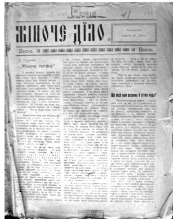
Іл. 2. Журнал та ілюстрація «Жіночого діла» (1912 рік)