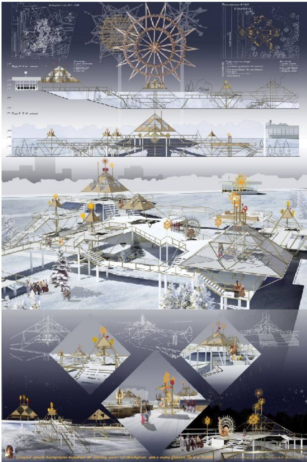
Рис. 3. Ескізний проект благоустрою території та дизайн малих архітектурних форм міського парку «Саржин Яр» в м. Харків. Вик. ст. 5 к. «Ю» Супрун А.О. Кер. доц. Олексієнко А.М., викл. Мироненко Н.Г.

кахлів, квітковими газонами; третя зона – криволінійної форми виставкова територія для керамічної скульптури. Використовуючи такі композиційні прийоми як трансформація, узагальнення, дотепну перебудову мотивів і форм, досягається сприйняття скверу як сучасного місця для відпочинку, в якому людина може спілкуватися з природою, а внутрішній зміст складових ландшафту несе пізнавальне значення. Система формоутворення малих архітектурних форм походить