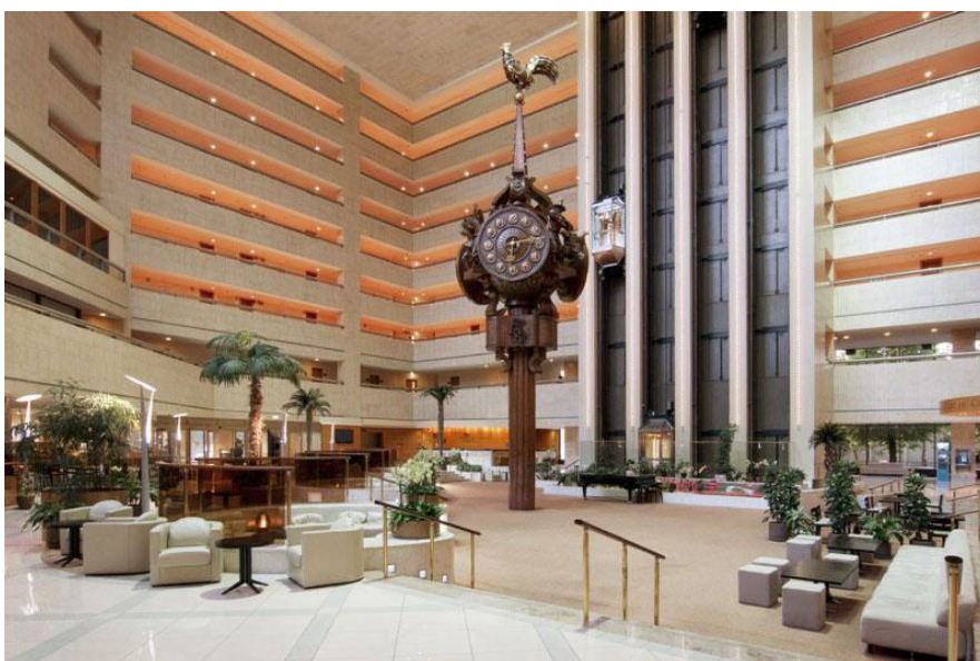
Вирішення архітектури і інтер'єру холу готелю “Краун Плаза” (Київ)

Від взаєморозташування головного входу в готель, стійкі оформлення і основних вертикальних комунікацій, дотримання технологічної їх послідовності (вхід - стійка оформлення - вертикальні комунікації) значною мірою залежить чіткість руху у вестибюлі і зручність користування ним.