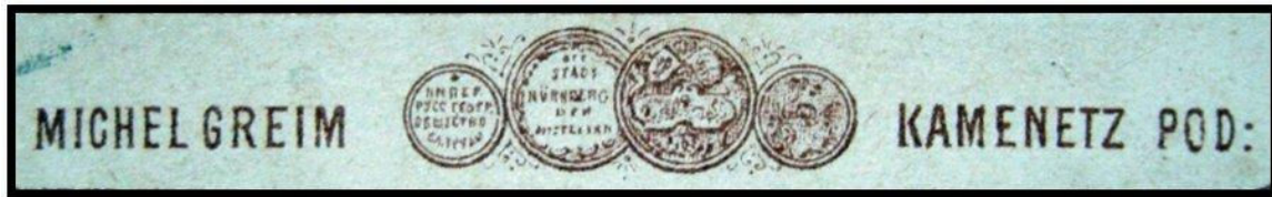
Рис. 1. Медалі, зображені на бланку М.Грейма. [2].