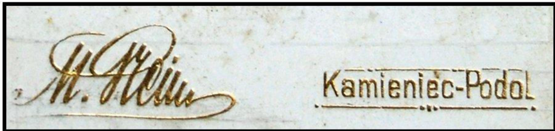
Рис. 2. Варіант з фрагментом бланку М.Грейма де використаний його підпис [4].