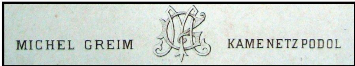
Рис. 3. Монограма зображена на бланку М.Грейма. [5].