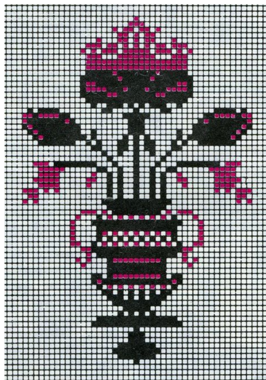
Рисунок 5. Берегиня [7:38].