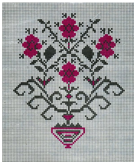
Рисунок 4. Берегиня [7:37].