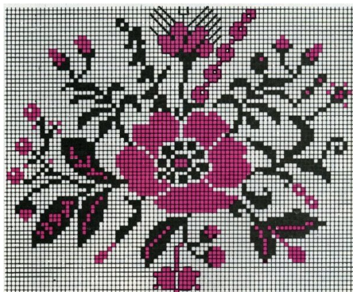
Рисунок 1. Квітка маку [7:18].