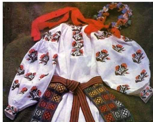
Рисунок 2. Жіноча сорочка [7:4].