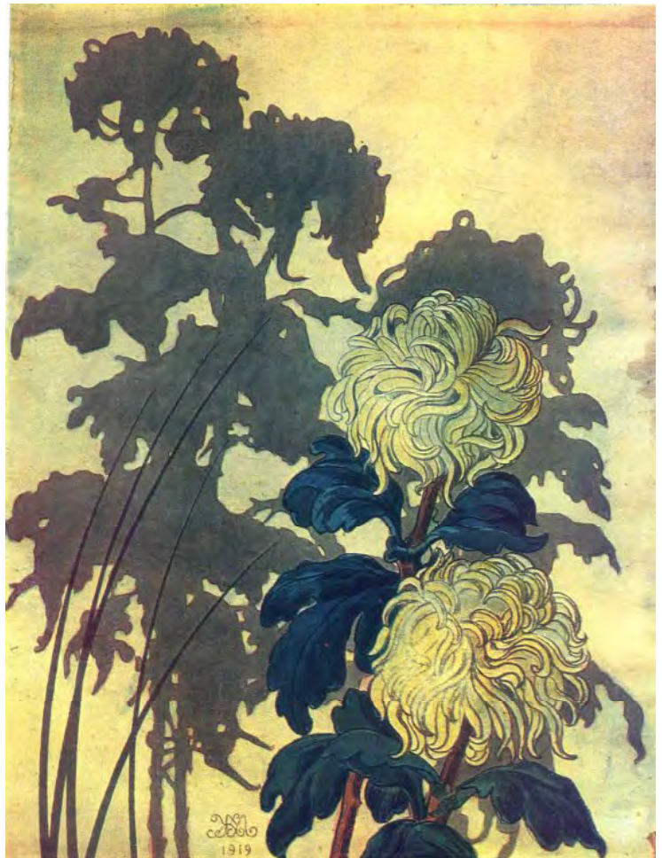
Іл. 35. М. Жук. Хризантеми. 1919. Пап., іт. ол. НХМУ