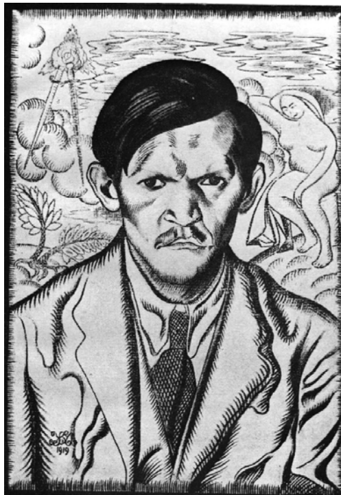
Іл. 20. М. Жук. Портрет Дмитра Загула. 1919. Пап., іт. ол. Друкарський відбиток