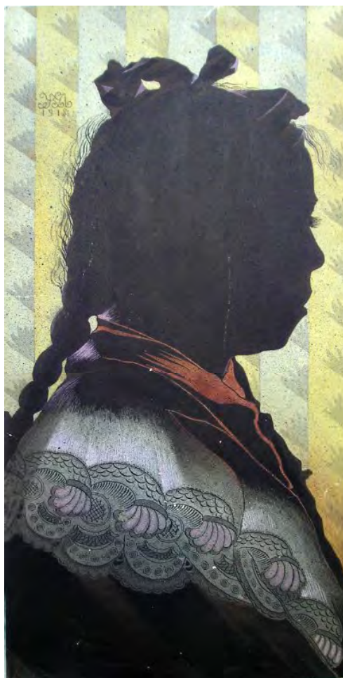
Гл. 12. М. Жук. Силует дівчини. 1918. Пап., зм. техніка. 29.9×57.7. Приват. зб. Т. Максим'юка (Одеса)