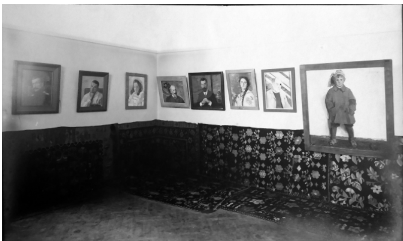
Іл. 6. Експозиція творів М. Жука (продовження). Київ, 22 листопада 1917 року. ЧЛММЗК. ФО-2943

зорі та квіткова гірлянда, знаходиться нині в архіві Чернігівського літературно-меморіального музею-заповідника М. Коцюбинського (іл. 7). Таке рішення, що повторює вже випробувані мистцем мотиви, його явно не влаштовує. Він шукає інші підходи в новому варіанті (іл. 8), в якому образотворчою метафорою стає зображена суцільною чорною плямою, де лише кілька білих ліній «намічають» окремі частини тіла, нахилена постать людини, закутаної в чорний плащ, із безнадійно опущеною рукою. Сидячи, чоловік вглядається в темну водяну яму, де плавають корона і лялька, а вгорі розгорнув величезні брунатні крила образ-символ, який можна трактувати як долю людини, фортуна, що панує над світом.