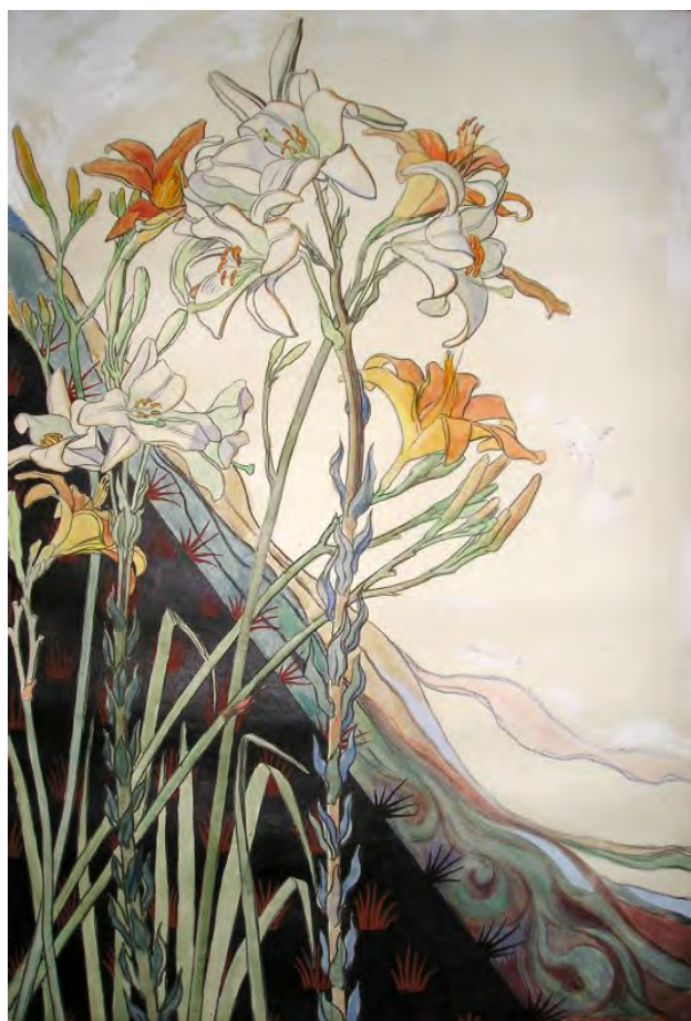
Лл. 32. М. Жук. Лілії. 1918. Пап., акв., гуаш. 100.3×67.4. ЧОХМ. Г-608