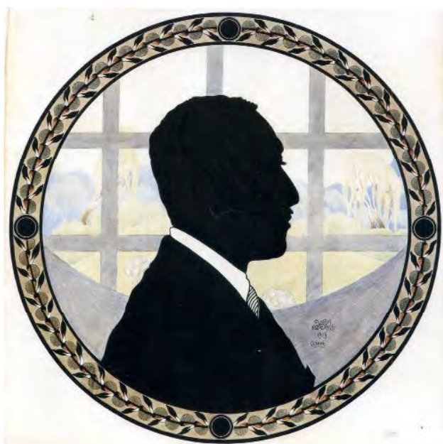
Гл. 14. М. Жук. Силуетний портрет невідомого. 1919. Пап., зм. техніка. 67×67. Приват. зб. (Київ)