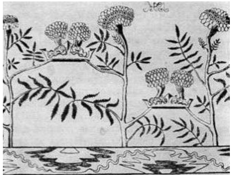
Лл. 18. М. Жук. Ілюстрація до журналу «Музагет». 1919. Друкарський відбиток