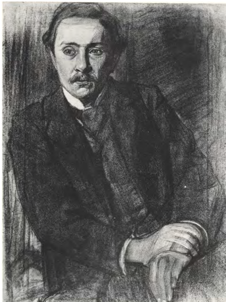
Іл. 25. М. Жук. Портрет Миколи Вороного. 1917. Пап., акв., ол. [22: іл. 17]