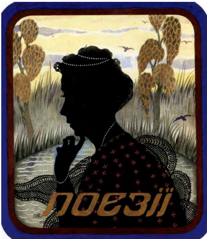
Лл. 9. М. Жук. Поезії. — Київ, 1919. Ескіз обкладинки. Пап., туш, гуаш, білило. 23.5×20.4. Приват. зб. (Одеса)