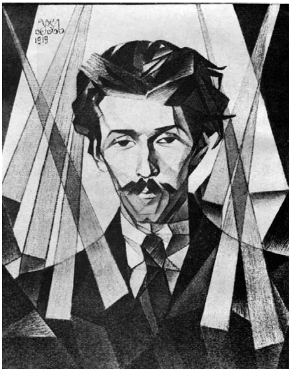
Іл. 19. М. Жук. Портрет Павла Тичини. 1919. Пап., іт. ол. Друкарський відбиток