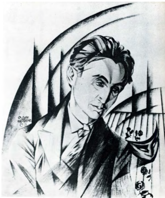
Іл. 22. М. Жук. Портрет Леся Курбаса. 1919. Пап., іт. ол. Друкарський відбиток