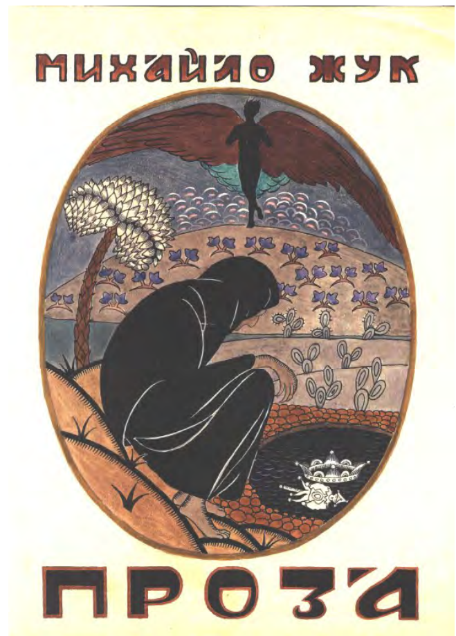
Лл. 8. М. Жук. Проза. — Київ, 1918–1919. Ескіз обкладинки. Пап., туш, гуаш, білило. Приват. зб. (Одеса)