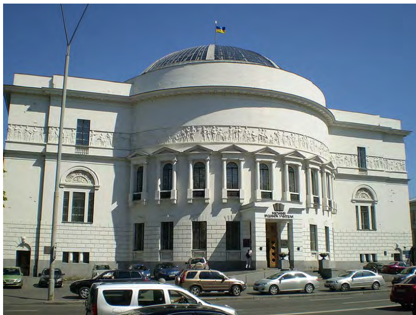
Іл. 2. Будинок Педагогічного музею у Києві, де у 1917 р. відкрилась Українська академія мистецтва