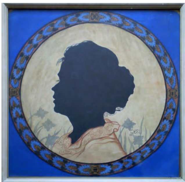
Гл. 13. М. Жук. Жіночий силует. 1919. Карт., туш, акв., гуаш, паст. 58.5×57.5. Приват. зб. (Одеса)