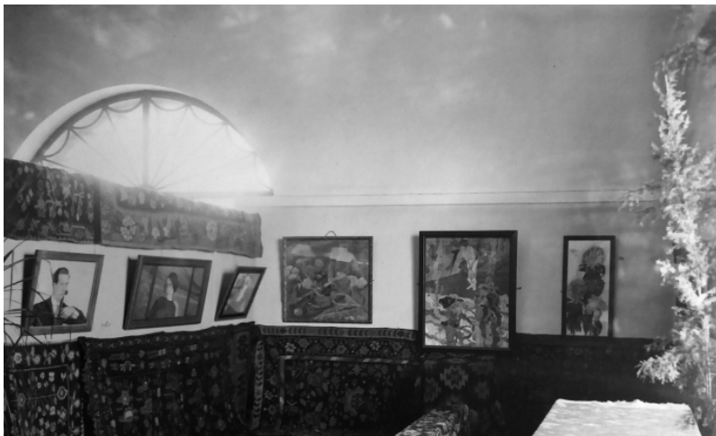
Іл. 4. Експозиція творів М. Жука. Київ, 22 листопада 1917 року. ЧЛММЗК. ФО-2933