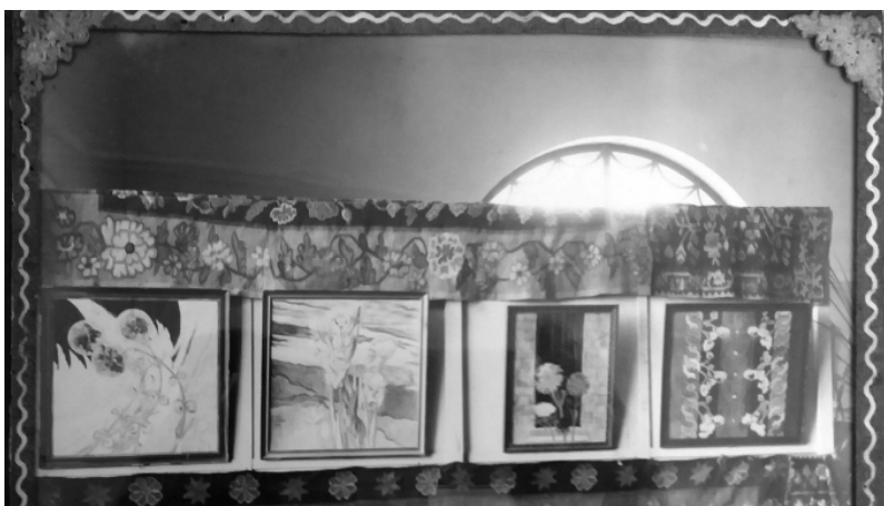
Іл. 5. Експозиція творів М. Жука. Київ, 22 листопада 1917 року. ЧЛММЗК. ФО-2933