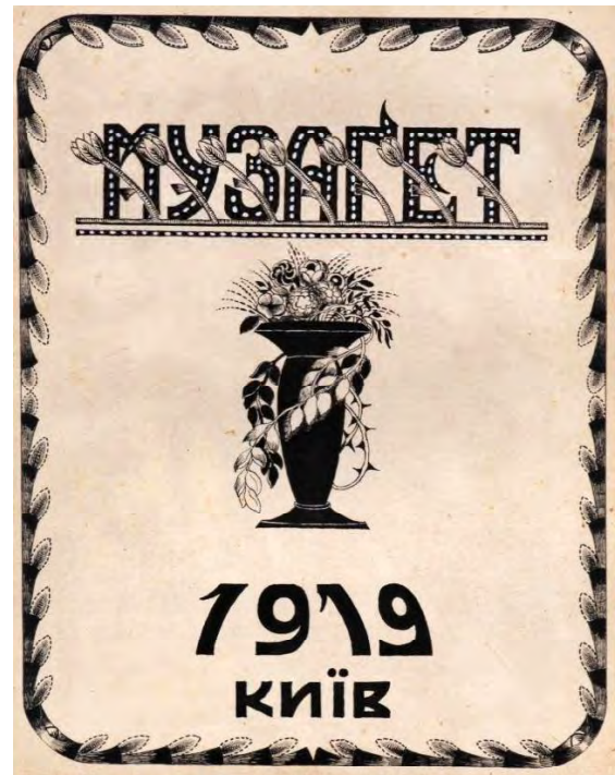
Лл. 16. М. Жук. Проект обкладинки літературного альманаху «Музагет». 1919. 27×21.5. Пап., зм. техніка. Приват. зб. (Київ)