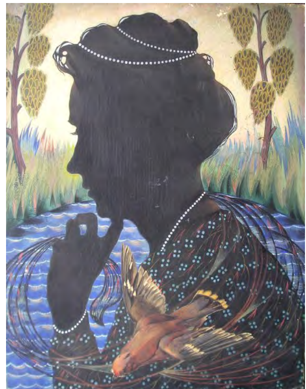
Лл. 10. Силует дружини. Кін. 1910-х. Карт., туш, гуаш, паст., білило. 56.2×43.0. Приват. зб. (Одеса)