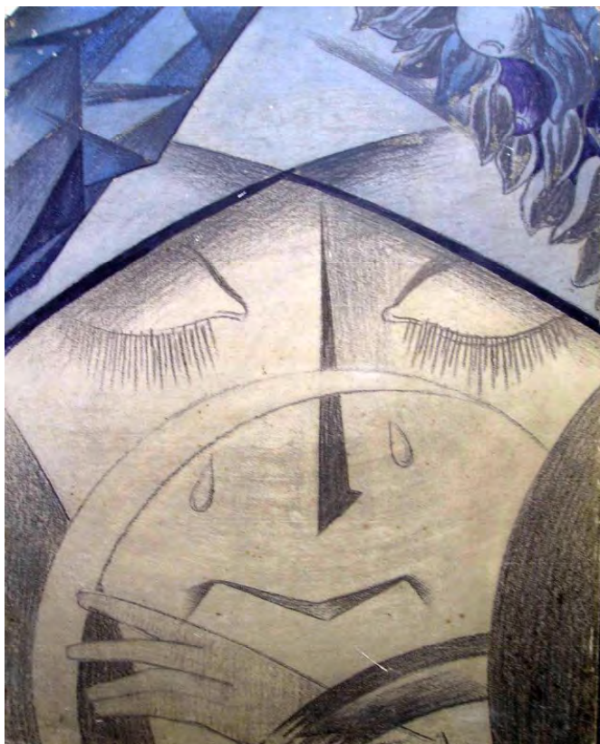
Іл. 26. М. Жук. Жінка з серпом. Кін. 1910-х. Пап., гуаш. 49x8.4. Приват. зб. Максим'юка (Одеса)