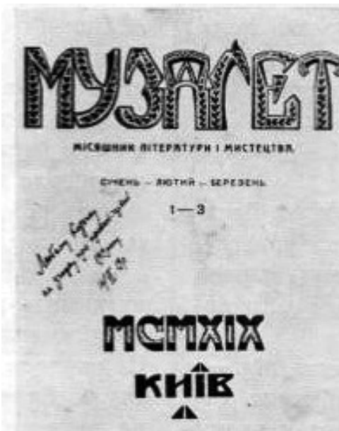
Лл. 17. М. Жук. Титульна сторінка літературного альманаху «Музагет». 1919. Друкарський відбиток