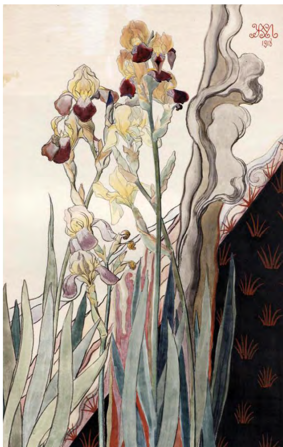
Лл. 31. М. Жук. Іриси. 1918. Пап., зм. техніка. 101×66. Приват. зб. (Київ)