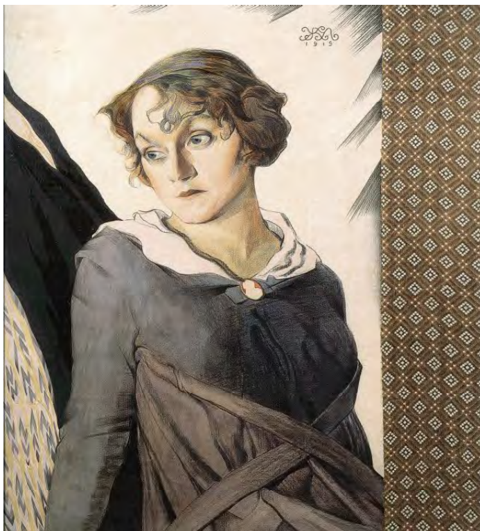
Лл. 30. М. Жук. Жіночий портрет. 1919. Пап., акв., іт. ол., туш, аплікація тканини. 77×67. НХМУ