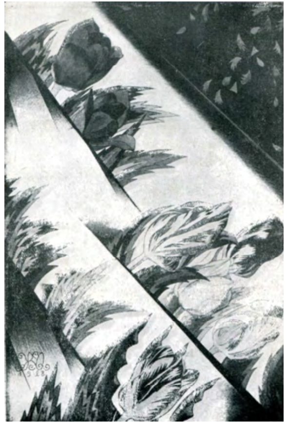
Іл. 34. М. Жук. Декоративне панно [21: іл.]