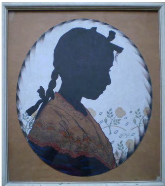
Гл. 11. М. Жук. Силует онуки Іллі Шрага. 1919. Карт., туш, гуаш, акв., іт. ол., білило, паст. 61.9×53.0. Приват. зб. (Одеса)