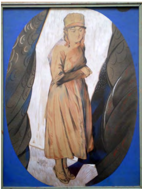
Лл. 29. М. Жук. Портрет Марії Заньковецької. 1919. Пап., накл. на карт., іт. ол., сангіна, паст., ол., гуаш, туш, білито. 68.6×51.4. Приват. зб. (Одеса)