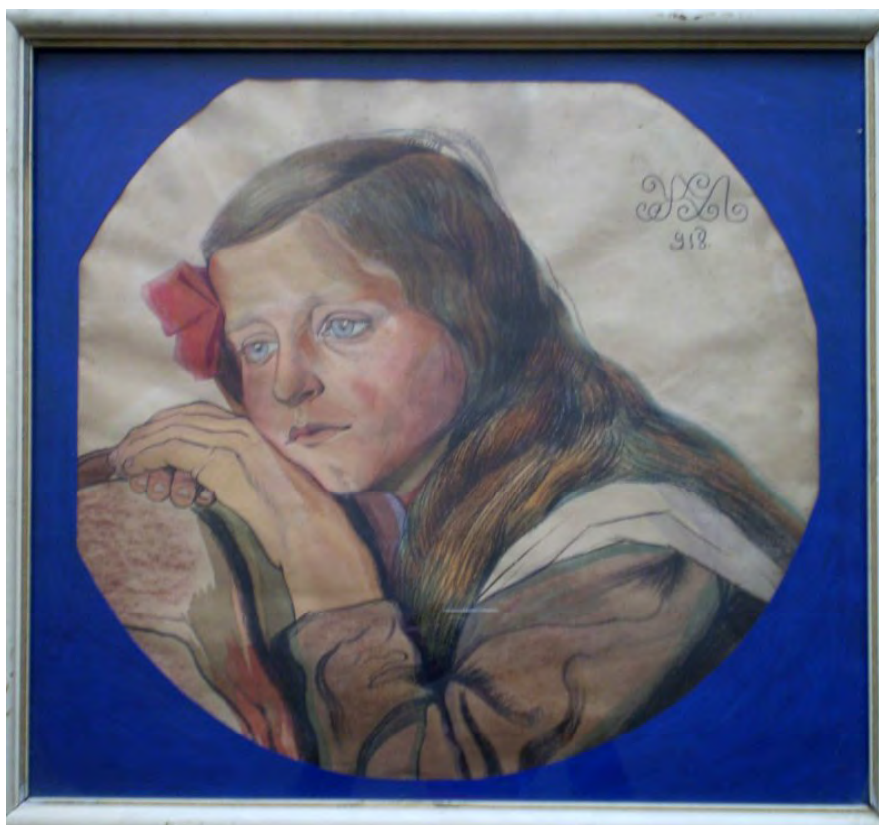
Іл. 28. М. Жук. Портрет дівчини. 1918. Пап., іт. ол., вуг., ол., гуаш, акв. 38.3x6.5. Приват. зб. (Одеса)