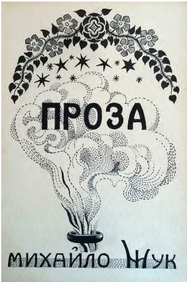
Лл. 7. М. Жук. Проза. — Київ. Кін. 1910-х. Ескіз обкладинки. Пап., туш, білило. 17.2×11.2. ЧЛММЗК. Г-234