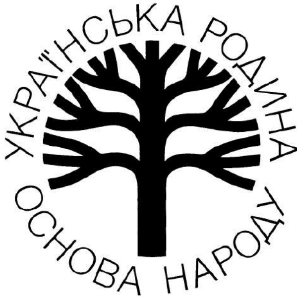
Іл. 1. Христина Зелінська. Емблема конгресу Світової Федерації Українських Жіночих Організацій. 1982 р. Репродуковано на обкладинці видання: «Четвертий Конгрес Світової Федерації Українських Жіночих Організацій».