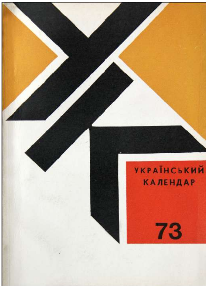
Іл. 6. Володимир Паньків. Обкладинка альманаху «Український Календар», 1972 р.