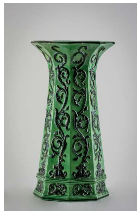
Лл. 16. Ваза. Києво-Межигірський фаянс. 1850 р.