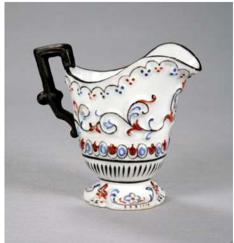
Іл. 18. Посудина для вершків. Волокитине. Сер. XIX ст.