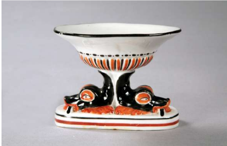
Іл. 17. Вазочка. Волокитине. Сер. XIX ст.