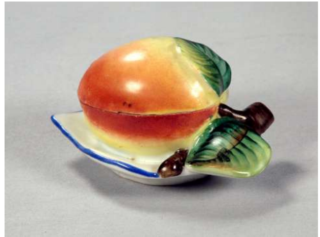
Іл. 20. Яблуко. Бонбоньєрка. Волокитине. Сер. XIX ст.