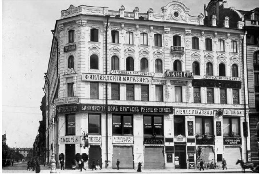
Лл. 2. Фасад будинку Гансена з боку Невського проспекту, 1912 р.

мав прізвисько «Апельсин». Такий збіг обставин видався цікавим, і дослідження було спрямовано на пошуки інформації про діда поляка. Відомості про нього зберігаються у вільному доступі мережі Інтернет. Проте повноцінне наукове дослідження про життя цієї людини було зроблено та опубліковано Германом Бертельсеном [29]. Нам пощастило спілкуватися з автором і зробити перший переклад його норвезького видання українською та російською мовами, що є унікальним матеріалом до біографії Оскара Германа Гансена.