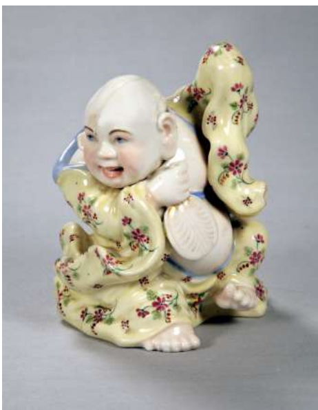
Іл. 21. Китайський божок. Скульптура. Волокитине. Сер. XIX ст.