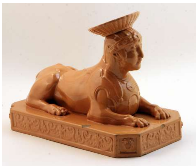
Лл. 15. Сфінкс. Скульптура. Києво-Межигірський фаянс. 1834 р.