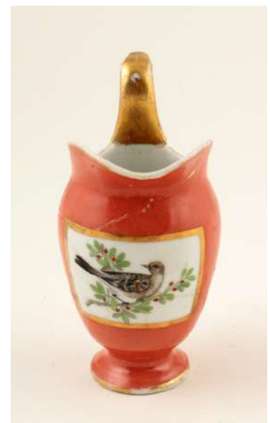
Іл. 23. Посудина для вершків. Баранівка. Поч. XIX ст.