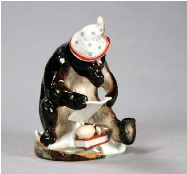
Іл. 19. Ведмідь. Скульптура. Волокитине. Сер. XIX ст.