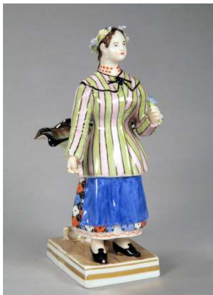
Іл. 22. Українка. Скульптура. Волокитине. Сер. XIX ст.