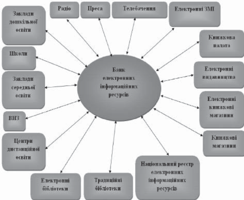
Рис. 2. Схема функціонування віртуального банку електронних інформаційних ресурсів

Усунення зазначених недоліків можливе за умови створення системи формування інформаційних ресурсів на основі віртуального банку електронних інформаційних ресурсів (БІР), схема функціонування якого подана на рис. 2.