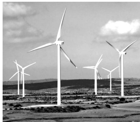
Рисунок 1 – Ветрогенераторы

Люди зачастую эстетически воспринимают ветрогенераторы (рисунок 1), как символ энергетики будущего.