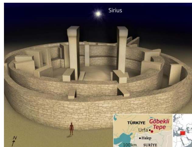
Рис. 3. Реалізація ідеї просторової і часової орієнтації в кільцевих храмах-обсерваторіях

4. Досконала з самої своєї появи кільцева модель Всесвіту в Гебеклі-Тепе забезпечувала успішність виховного впливу на молодь і формування в їх головах уявлення про закони Природи та глибокого усвідомлення необхідності відмови від знищення інших Хомо, адже вони не тварини, а також належать до обранців Небес. Цілком незаперечним фактом є спорудження 13 500 років великою групою наших і європейських пращурів найпершого «храму-обсерваторії» у формі кільця з великих плоских каменів. В його центрі ставили величезні Т-подібні плити з різноманітним різьбленням. Тому усередині споруди навіть у повній темряві легко визначали сторони світу, а в момент появи чи зникнення сонячного диску з непоганою точністю орієнтувалися щодо днів року. Рис. 3 вказує ідею виділення напрямку на Полярну (тоді це був яскравий Сиріус) і визначення інших сторін світу.