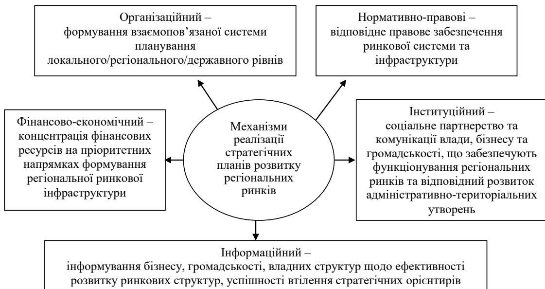
Рис. 2. Механізми реалізації стратегій та планів

Застосування інструментів інституційного механізму реалізації стратегій регіонального розвитку орієнтує на активне застосування публічно-приватного партнерства та тісний зв'язок з розвитком міжрегіональних ринків. Сьогодні актуальність залучення цих інструментів підтверджується тим, що партнерство є альтернативним способом фінансування стратегічних планів соціально-економічного розвитку територій, адже наявні бюджетні кошти не дають змогу владі