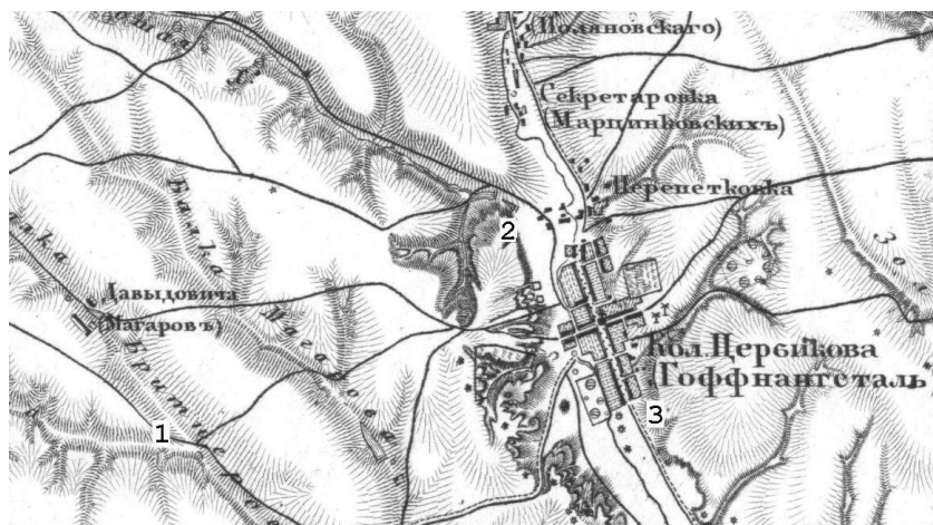
1 - Мардарівка; 2 - Цебрикове; 3 - Цебрикове 1