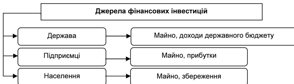
Рис. 2. Джерела фінансових інвестицій Джерело: узагальнено з урахуванням [9; 10; 13 та ін.]

Наступним аспектом у визначенні сутності інвестицій є встановлення їх фінансових джерел (рис. 2).