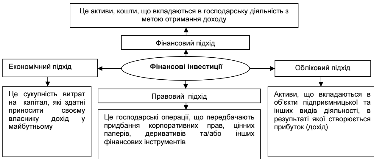
Рис. 3. Підходи до трактування сутності "фінансові інвестиції", "фінансові вкладення"