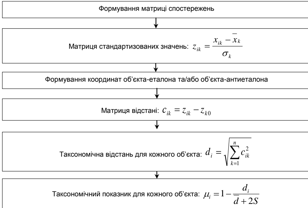
Рис. 2. Етапи таксономічного аналізу конкурентного потенціалу підприємства

Поетапно застосування методу таксономічного аналізу відображено на рис. 2.