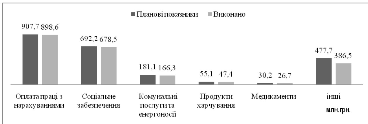
Рис. 3. Виконання бюджету міста по видатках загального фонду бюджету за економічною сутністю

197,4 млн грн, з яких видатки бюджету розвитку – 108,7 млн грн, що становить 24,3% планових показників на відповідний період. До державного бюджету перераховано реверсної дотації в сумі 92,6 млн грн, що дорівнює плановим показникам [7]. Виконання бюджету міста по видатках загального фонду бюджету за економічною сутністю наведено на рисунку 3.