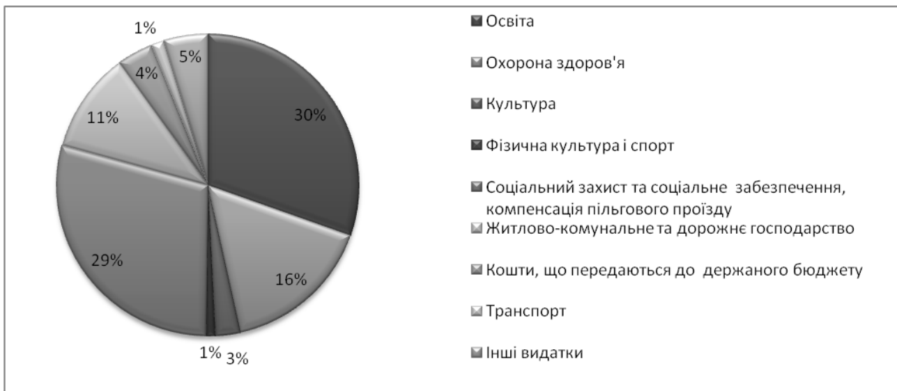
Рис. 2. Структура видатків бюджету м. Запоріжжя за функціональною ознакою за I півріччя 2016 року

За функціональною ознакою напрямки використання коштів наведені на рисунку 2.