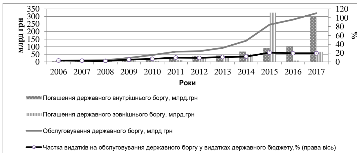
Рис. 2. Динаміка погашення і обслуговування державного боргу та його частка у видатках державного бюджету у 2006-2017 роках, млрд грн

Варто відмітити взаємопроникнення боргової і бюджетної політики та зазначити, що високе боргове навантаження й значні видатки на обслуговування боргу є причиною зменшення первинних видатків бюджету на активізацію економічної діяльності. В результаті відбувається збільшення витрат на погашення й обслуговування державного боргу у середньостроковій перспективі та зменшуються фінансові можливості для реалізації пріоритетних соціально-економічних програм. Викликом для боргової політики України є не лише суттєве зростання обсягу державного боргу, а й виплат за ним (рис. 2).