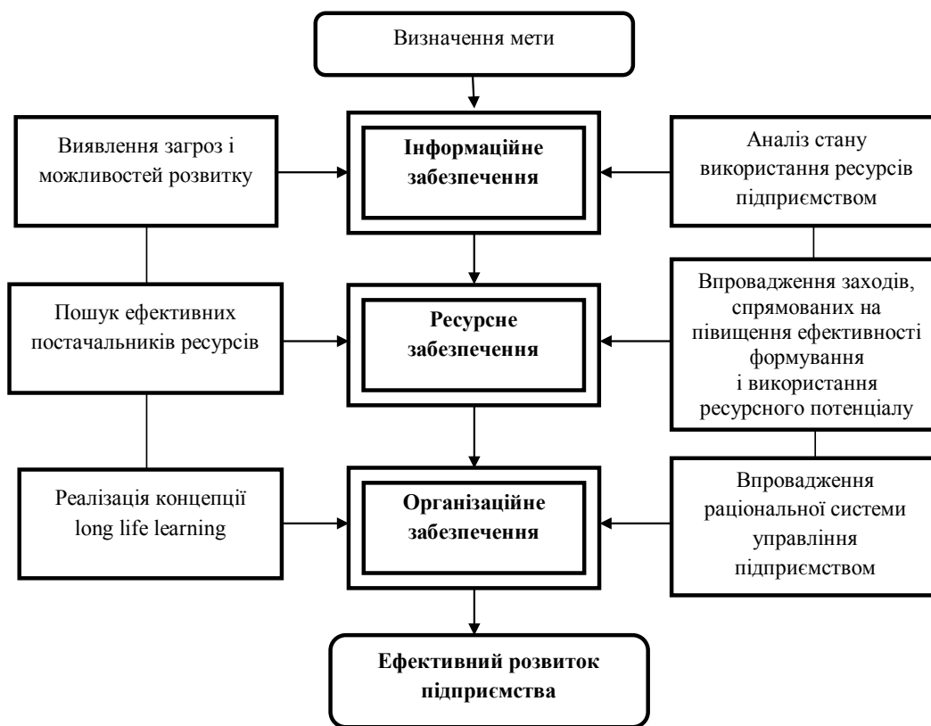
Рис. 2. Складники ефективного управління розвитком підприємств

При створенні об'єднання підприємств доцільно централізувати функцію управління якістю, що дозволить дотримуватися єдиних високих стандартів в роботі і сформувати позитивний імідж корпорації.