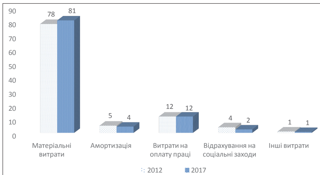
Рис. 1. Структура витрат на виробництво поліграфічних підприємств за 2012, 2017 рр. [8]

Удосконалення організації управління пов'язано з впровадженням програмно-цільових організаційних