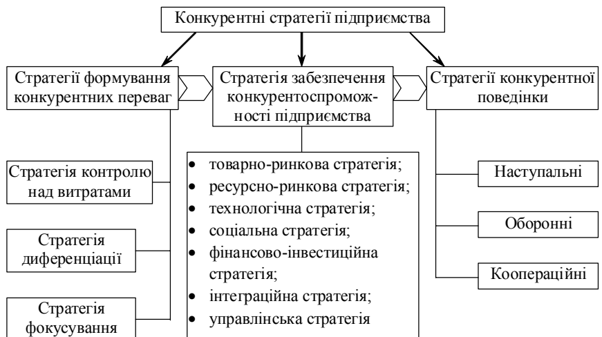
Рис. 2. Система конкурентних стратегій підприємства

Системою конкурентних стратегій названа сукупність стратегій, націлених на адаптацію до змін в умовах конкуренції та на зміцнення довгострокової конкурентної позиції підприємства на ринку. До того ж ці стратегії доцільно опрацьовувати в певній послідовності, яка показана на рис. 2. двома фігурними стрілками. В літературі найбільш поширеною є класифікація стратегій формування конкурентних переваг, яка запропо-