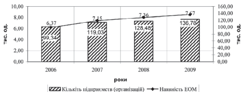
Рис. 1. Порівняння кількості підприємств і наявності ЕОМ

За результатами статистичних спостережень кількість підприємств (організацій), що мали на балансі обчислювальну техніку та парк електронно-обчислювальних машин (далі — ЕОМ) в 2009 р. всього становила 7671 підприємств, що на 4,18 % більше порівняно з 2008 роком. У період 2006—2009 р. найбільша кількість ЕОМ була на підприємствах, що