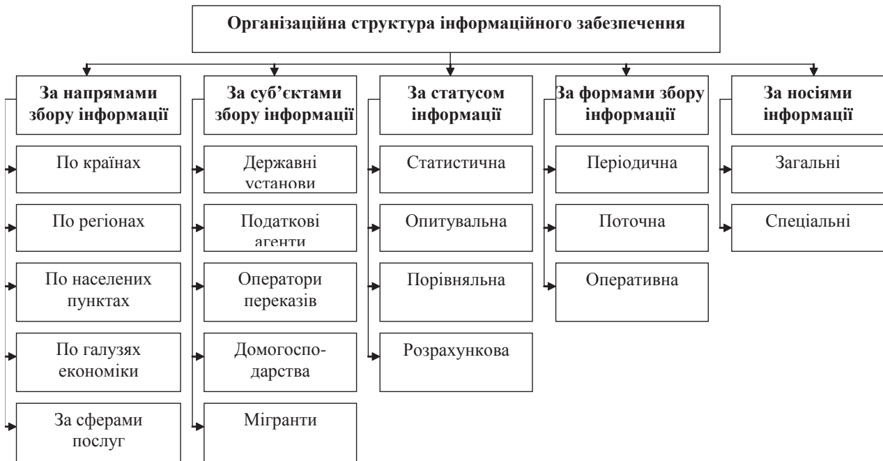
Рис. 3. Методологічна схема організації інформаційного забезпечення обчислення обсягів міграційного капіталу

Джерела і носії інформації, що використовується для аналізу міграційно-трудоових процесів і міграційного капіталу, розподіляються на загальні і спеціальні. Загальними джерелами інформації є існуючі реєстри діючої системи, обліку і звітності, призначені в цілому для інформаційного забезпечення управління економікою. Спеціальні джерела і носії інформації розробляються і застосовуються для збору даних, необхідних насамперед для аналізу процесів трудової міграції і міграційного капіталу. Більш конкретно джерела і носії даних розрізняються в залежності від напрямів аналізу трудової міграції і міграційного капіталу. Можуть бути використані три форми організації збору і підготовки даних для аналізу процесів трудової міграції і обсягів міграційного капіталу: 1) періодична; 2) поточна; 3) оперативна. Це зумовлено різницею у періодичності здійснення аналізу процесів міграції і міграційного капіталу за тими чи іншими напрямками.