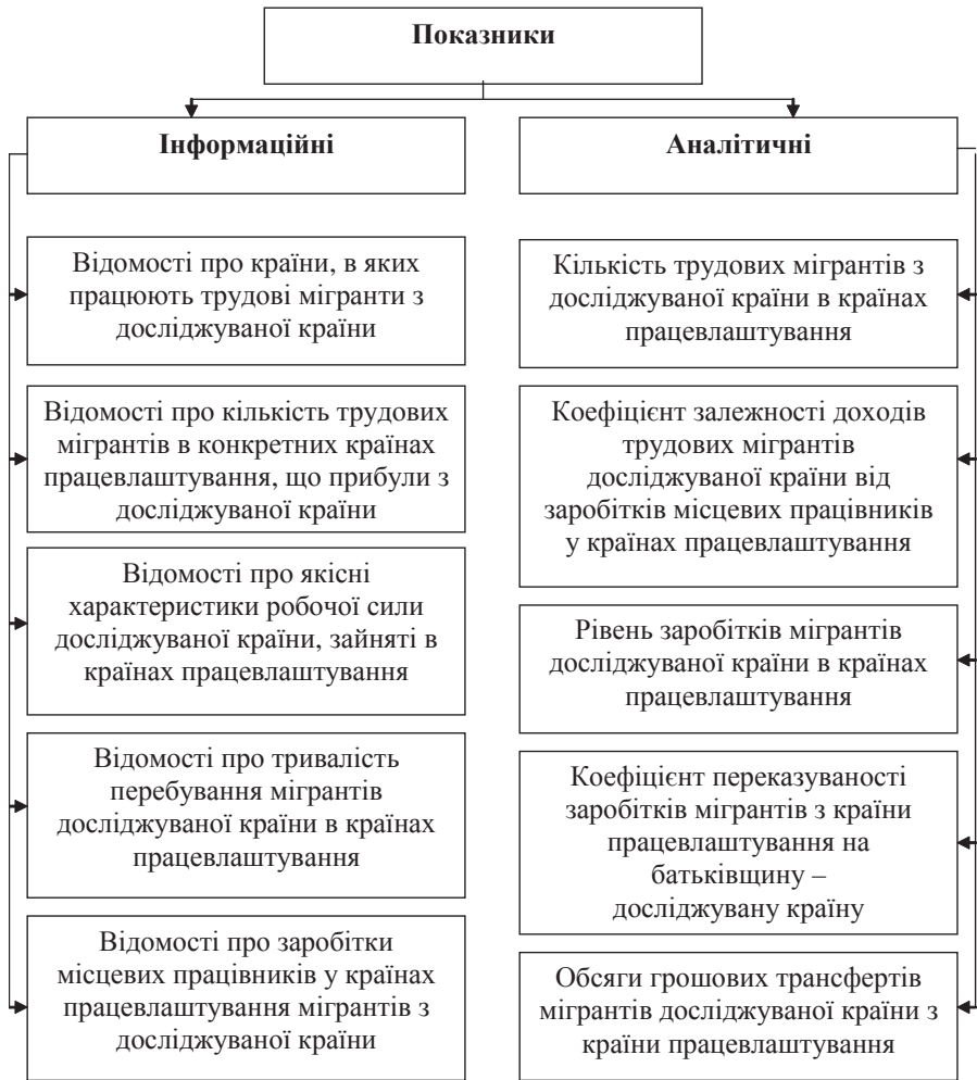
Рис. 2. Основні інформаційні та аналітичні показники обчислення обсягів міграційного капіталу

Методологічна схема обчислення обсягів міграційного капіталу (рис. 1) містить п'ять етапів: 1) підрахунок кількості мігрантів у країнах працевлаштування; 2) визначення рівня доходів місцевих найманих працівників; 3) підрахунок доходів, які можуть заробляти мігранти; 4) визначення частки (коефіцієнта) переказуваності заробітків мігрантами на батьківщину; 5) фактичний підрахунок грошових переказів по країнах.