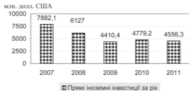
Рис. 3. Динаміка прямих іноземних інвестицій в Україну за рік

З іншого боку, співробітництво України з міжнародними організаціями будується переважно на кредитній основі. Україна бере безпосередню участь у діяльності провідних міжнародних валютно-кредитних та фінансових організацій ІМВФ, МБРР, ЄБРР, ЄІБ). За весь період співробітництва Україні надано ресурсів від МБРР на суму 7,27 млрд дол. США для фінансування 116 проектів; з боку ЄБРР — на суму біля 9,91 млрд дол. США для впровад-