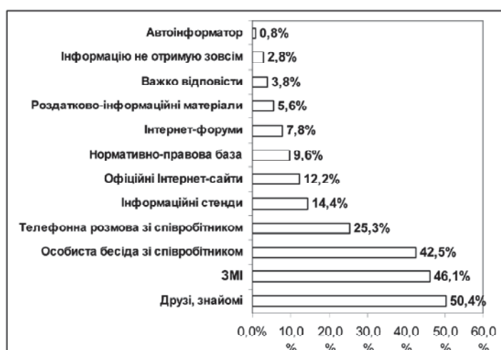
Рис. 2. Розподіл відповідей на питання "З якого джерела Ви отримали найбільш повну інформацію про порядок надання адміністративної послуги?" (у % до опитаних) (респондентам пропонувалось обрати не більше трьох варіантів відповідей)

На відкрите питання щодо власного досвіду отримання адміністративних послуг від органів влади відповіло 40% від опитаних респондентів. Максимальна кількість відповідей стосується оформлення та отримання пенсії, і, відповідно, пенсійний фонд посідає перше місце у рейтингу.