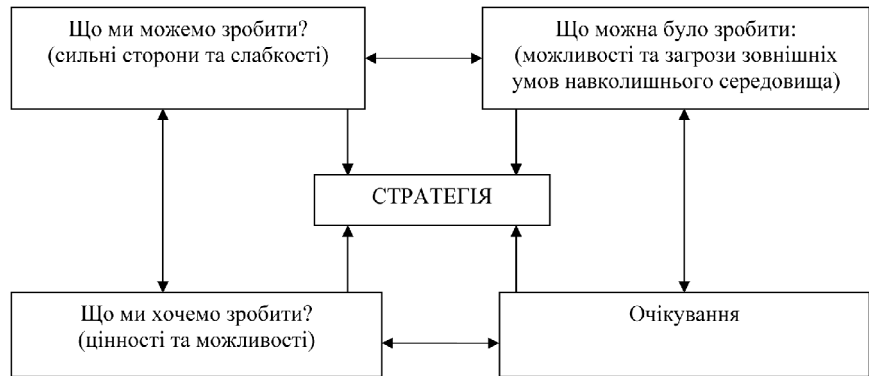
Рис. 2. Схема проведення SWOT-аналізу

можливості в реальні, збільшуючи вірогідність їх реалізації. Реалізуючи певні стратегічні кроки та працюючи над слабкими сторонами, змінюючи певним чином свою стратегію державної політики національної безпеки, держава може перетворити загрози на сприятливі стратегічні альтернативи.