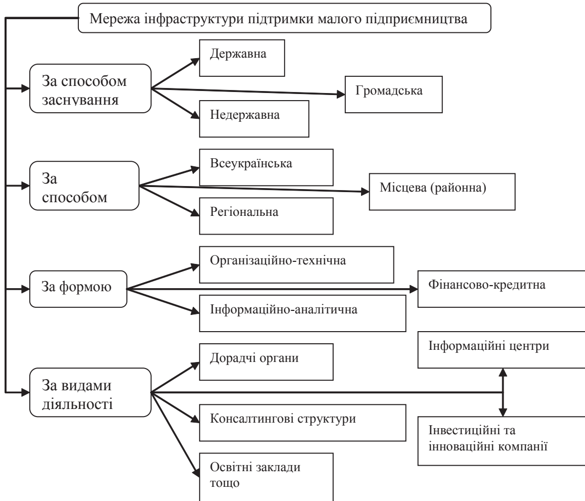
Рис. 2. Класифікація мережі інфраструктури підтримки малого підприємництва

Інфраструктура підтримки малого підприємництва в Україні — це сукупність організаційних структур (центри підтримки підприємництва, бізнес-інкубатори, технопарки, консалтингові фірми, маркетингові та інші організації), заснованих на різних формах власності. Інфраструктура сприяє створенню та функціонуванню підприємницького сектору в умовах перехідної економіки і формує конкретне організаційно-економічне середовище для стимулювання підприємницької діяльності та швидкої адаптації суб'єктів малого підприємництва до ринкових умов.