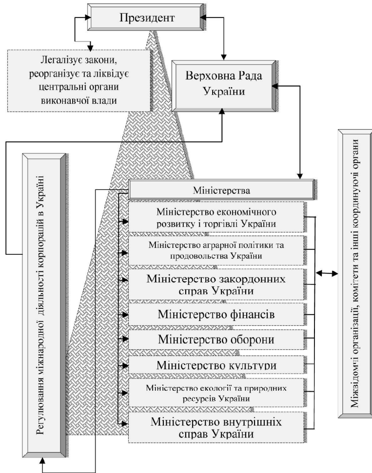
Рис. 1. Система державних механізмів регулювання міжнародної діяльності корпорацій в Україні