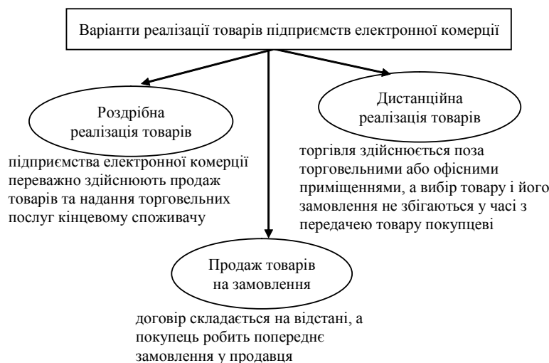
Рис. 1. Можливі варіанти реалізації товарів підприємств електронної комерції

Необхідно зазначити той факт, що законодавством України не передбачено окремого нормативного документа, який би регламентував реалізацію товарів підприємств електронної комерції, отже вона регламентується тими самими документами, що й інші види торгівлі.