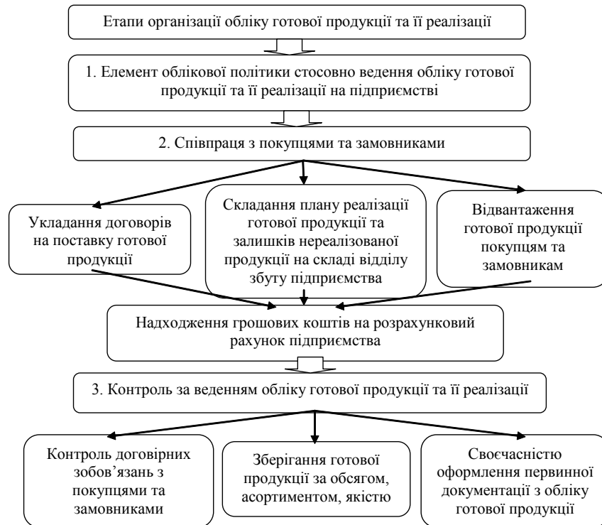
Рис. 1. Етапи організації обліку готової продукції та її реалізації