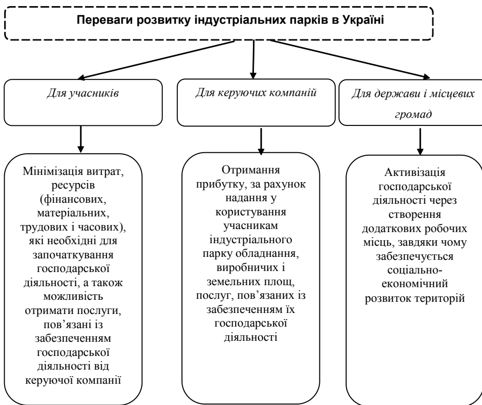
Рис. 1. Переваги розвитку індустріальних парків в Україні

лених інвестиціями. В. Федоренко [2] проводив аналіз позитивних чинників, що зумовлюють вплив на надходження іноземних інвестицій в економіку України. К. Ілляшенко [3] вивчав питання зниження інвестиційних ризиків для підвищення ефективності залучених інвестицій. О. Федорчак [4, с. 137] зазначає, що в Україні за роки незалежності існувало багато чиновників і бюрократичних структур, покликаних регулювати залучення інвестицій.