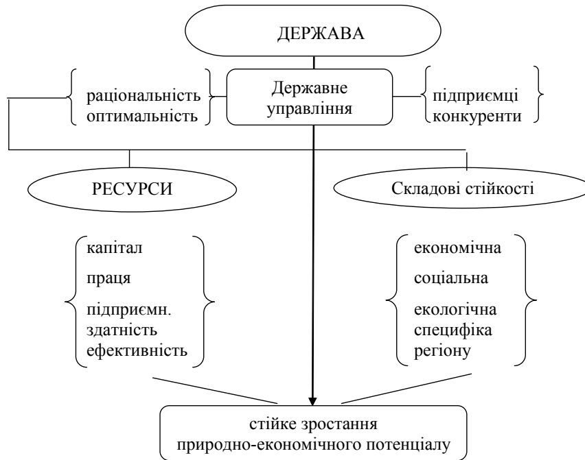
Рис. 2. Основи стійкого розвитку природно-економічного потенціалу при здійсненні державного управління

Стійкість, як і багато інших характеристик системи, динамічна. Ступінь її динамічності залежить від політики маркетингу на всіх рівнях економіки.