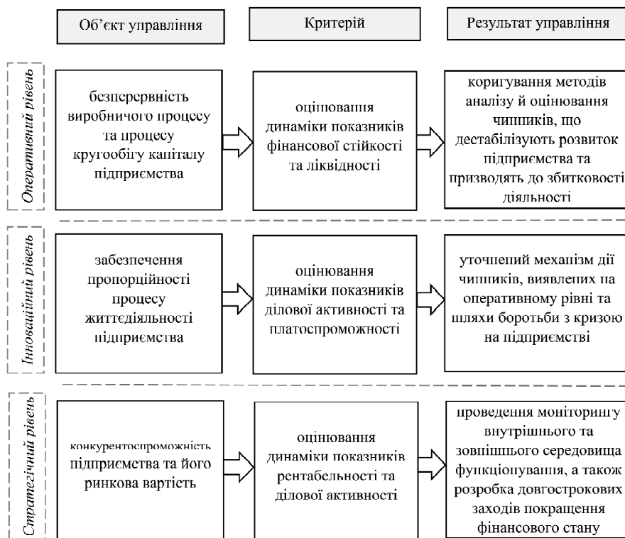
Рис. 3. Механізм управління фінансовим станом на підприємстві